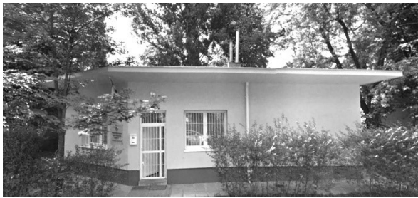
Pavilon felújítva, átépített nyílásokkal, Gyenes utca 16