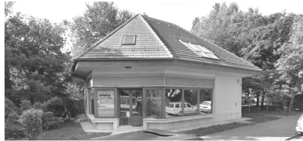
Pavilon felújítva, magastetővel, Gyenes utca 20

A fenti újraértelmezések a történeti és építészeti kontextusból teljességgel kilógó, torz megoldásokat szültek, egymás mellett bemutatva hogyan lehet az egységességet és az épített értékeket eltüntetni.