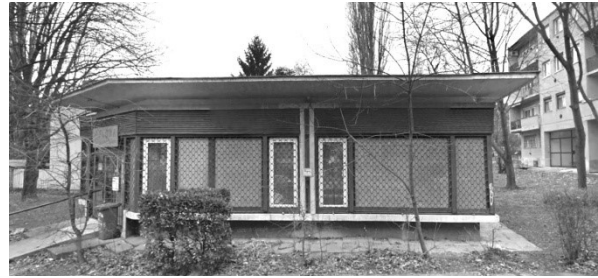
Pavilon eredeti állapotában, Gyenes utca 12 fotó: Google Streetview