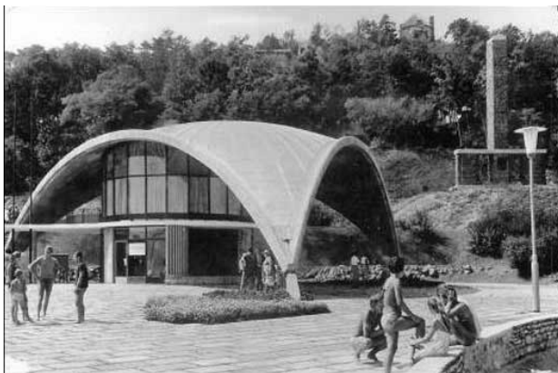
Idegenforgalmi és postahivatal, Tihany, 1969

Szép példa a kor héjszerkezetű épületére a nemrég felújított Idegenforgalmi és postahivatal (Bérczes István és Szittyá Béla, 1962) a Tihanyi Öregkikötőben, ami ma is népszerű vendéglátóhelyként működik, vagy a Szántódi Rév épülete (Dianóczky János, 1962–1963). Hogy a közelben maradjunk a Kosztolányi Dezső téri volt buszpályaudvar tetőszerkezetét, vagy a Széll Kálmán téri legyezőt is ide sorolhatjuk. Érdekesség, hogy a Műszaki Egyetem oktatóreaktor-épületének formavilága is egészen hasonló.