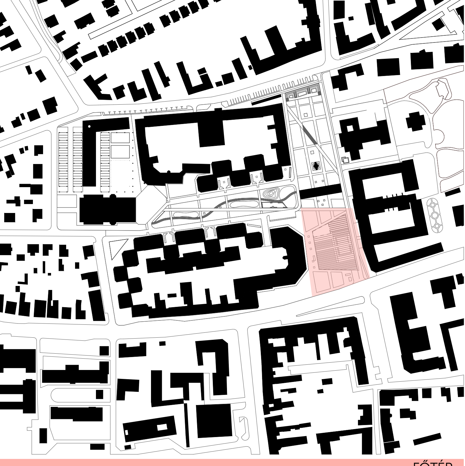
- FÖTÉR -

ESTÉNKÉNT A TÉR ALATT TALÁLHATÓ SZÓRÁKOZÓHELY LENNE A SZÓRÁKOZÁS KÖZPONTJA.