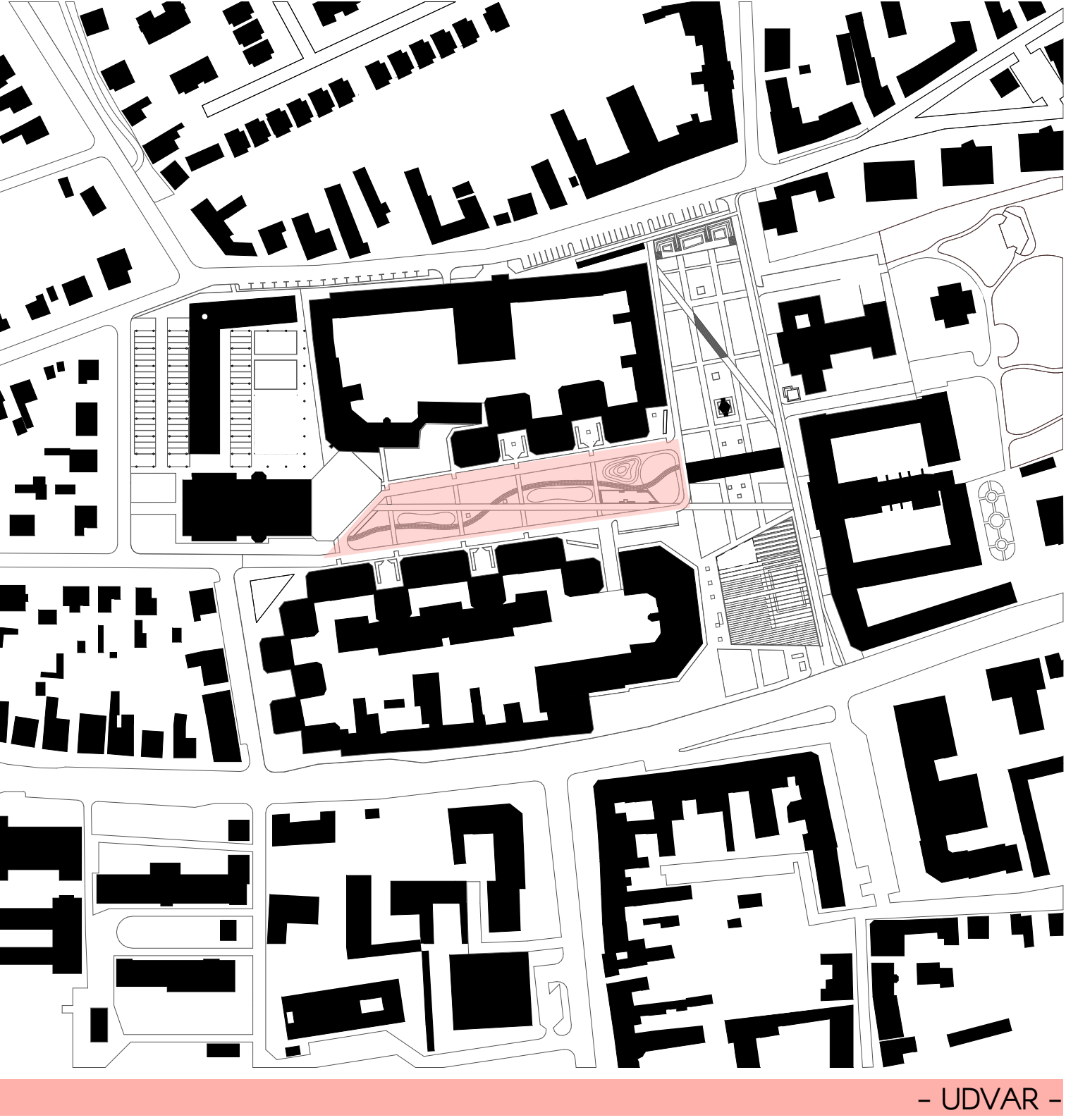
- UDVAR -

A TERÉN "L" ALAKBAN ELHELYEZETT PAVILON JELEKÉNT ÉPÍTMÉNYEM MAGÁBA FOGLALJA A PIACI IGAZGATÁS FUNKCIÓIT, EGY REGGELIZŐ-PÉKSÉGET, RAKTÁRAT ÉS A SZABADTÉRI TEVÉKENYSÉGEKHEZ KAPCSOLÓDÓ ÖLTÖZŐ-MODSÓ BLOKKOT.