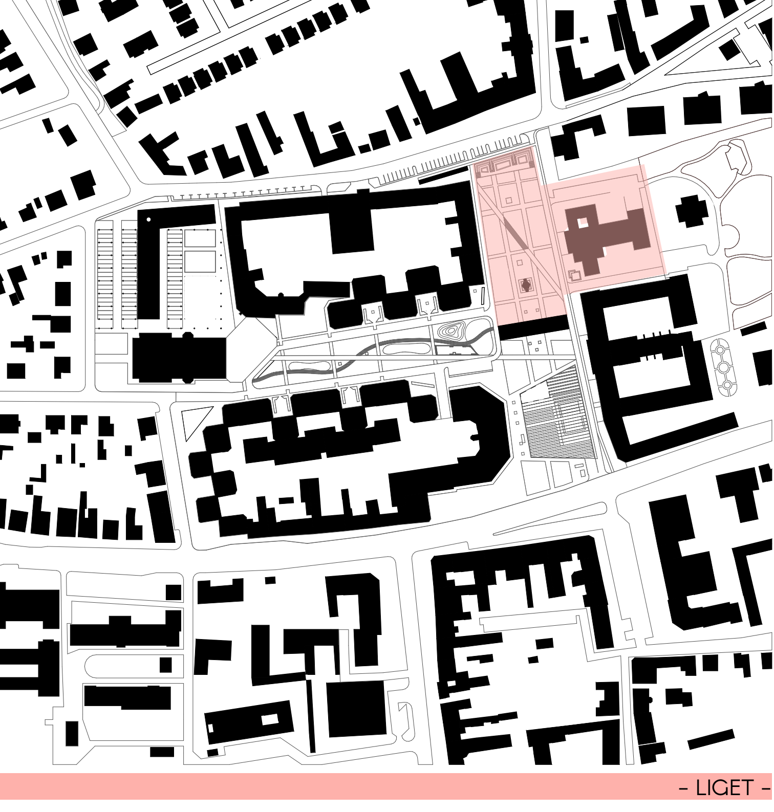
- LIGET -

A CIKK-KAKKOSAN BEÉPITETT TÁRSASHÁZAK KÖZÖTTI UDVAROKBA IS BEFOLYNAK A TEREM, EZEKBE AZ OTT LAKÓK SZÁMÁRA ALAKÍTOTTAM KI "PRIVÁT" UDVAROKAT, AHOZ LE TUDNAK ÜLNI, TUDNAK TALÁLKOZNI BESZÉLGETNI.