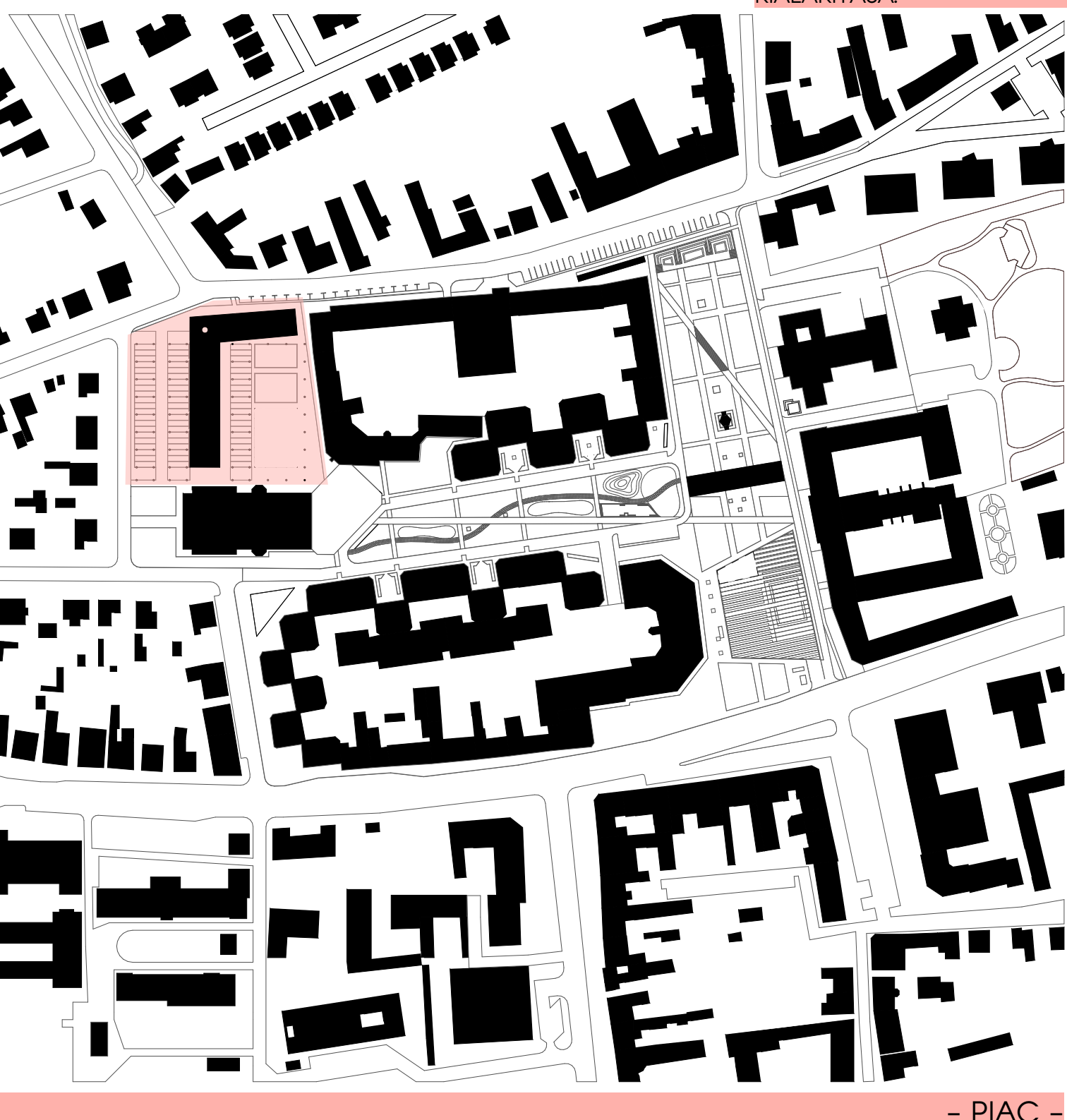
- PIAC -

FONTOS A TÉR KÜLSŐ HATÁROAIN ALAKÍTÁSA, OPTIMALIZÁLÁSA. A KÖZVETLEN ÉS KÖZVETETT KAPCSOLATOK MEGFELELŐ KIALAKÍTÁSA.