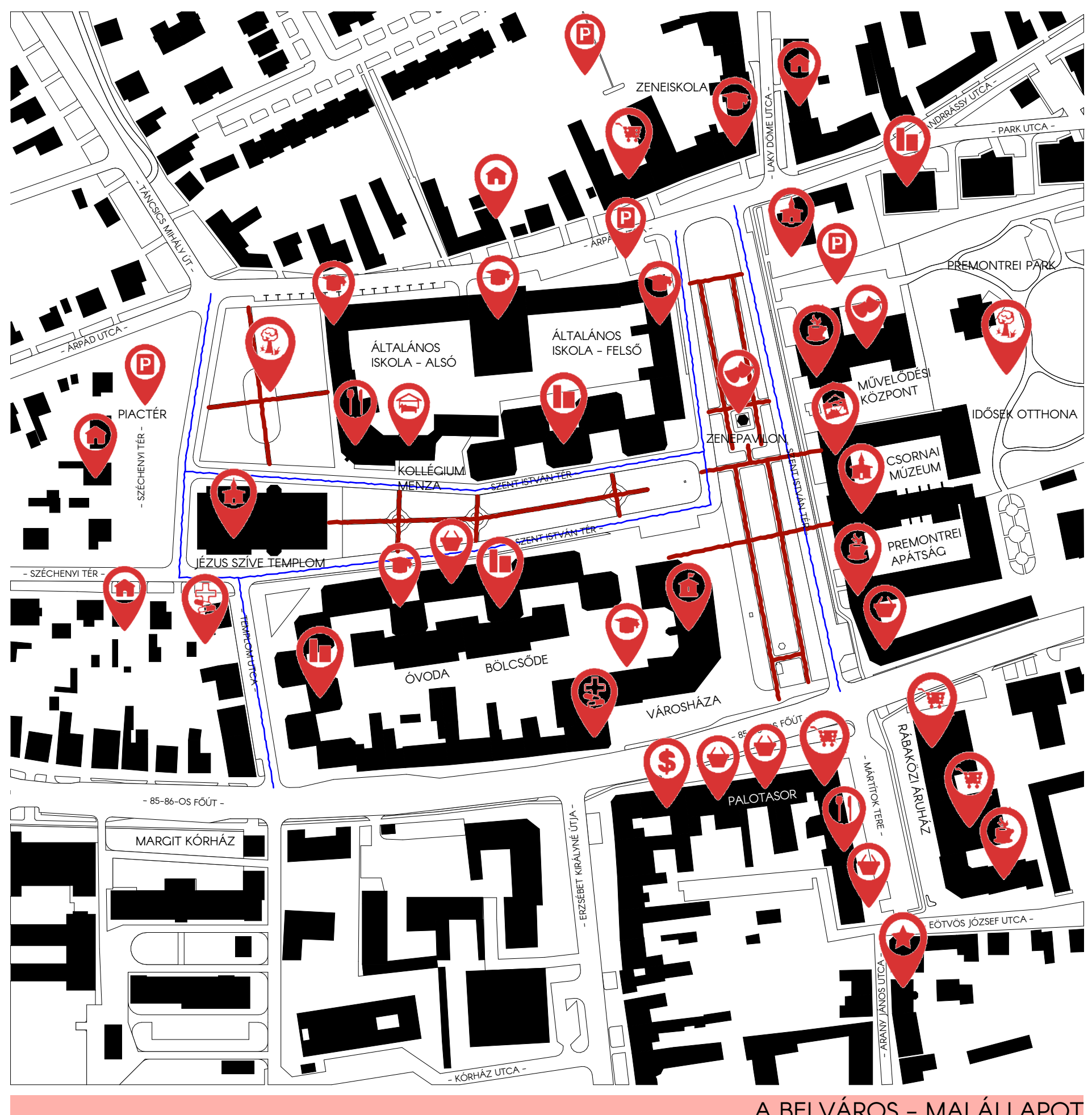
A BELVÁROS - MAI ÁLLAPOT

CSORNAI LAKOSKÉNT SZERETNÉK TENNI A VÁROS FEJLŐDÉSÉÉRT, VÉLEMÉNYEM SZERINT ENNEK AZ ELSŐ LÉPÉSE, A JELENLEG A TELEPÜLÉSEN LAKÓK HELYBEN TARTÁSA, A VÁROS ÉS EZEN BELÜL IS A BELVÁROS EGYIK LEGNAGYOBB PROBLÉMÁJA, HOGY KIALAKULT KÖZPONT NEM VONZÁK AZ EMBEREKET, NEM MÉLTÓ EGY VÁROSI TÉRHEZ, A LEGTOBBEN CSAK VÁSÁROLNI JÁRNAK ODA, MIVEL "NINCIS MIT CSINÁLNI". EBBŐL KIFOLYÓLAG A TERVEZÉSI TERÜLETET A VÁROSKÖZPONT LETT, AHOZ TÖBBEK KÖZÖTT A PREMONTREI APÁTSÁG, A VÁROSHÁZA, A MŰVELŐDÉSI KÖZPONT ÉS A SZÉCHENYI ISTVÁN ÁLTALÁNOS ISKOLAI TALÁLHATÓ A TERÜLETHEZ KAPCSOLÓDIK A PIACTER, AMELY JÓ HELYEN TALÁLHATÓ A VÁROSBAN, VISZONT AZ INFRASTRUKTURÁLIS SZERVEZÉSE NEM A LEGMEGFELELŐBB.