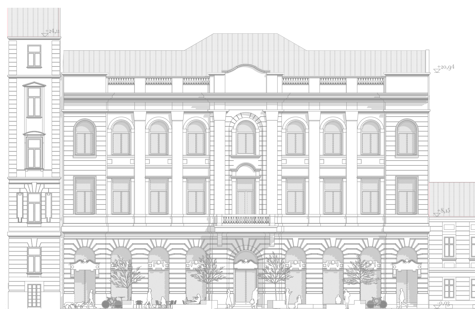
Uteakép m 1:200

Az utcai homlokzat nyugodt és egységes. A földszint megnyílik, belátunk a teljes belmagasságú, teljes hosszában egybenyitott, üvegezett árkád hangulatú első traktusba. Feltárl a nagyvonalú fogadóter és a kávézó, előtte fákkal árnyékolt terasz. A nagy nyílások körül ugyanaz a fém keret jelenik meg, mint ami az új udvari bővítést jellemzi, így kapcsolódnak össze az új beavatkozások, áthatva a földszintet.