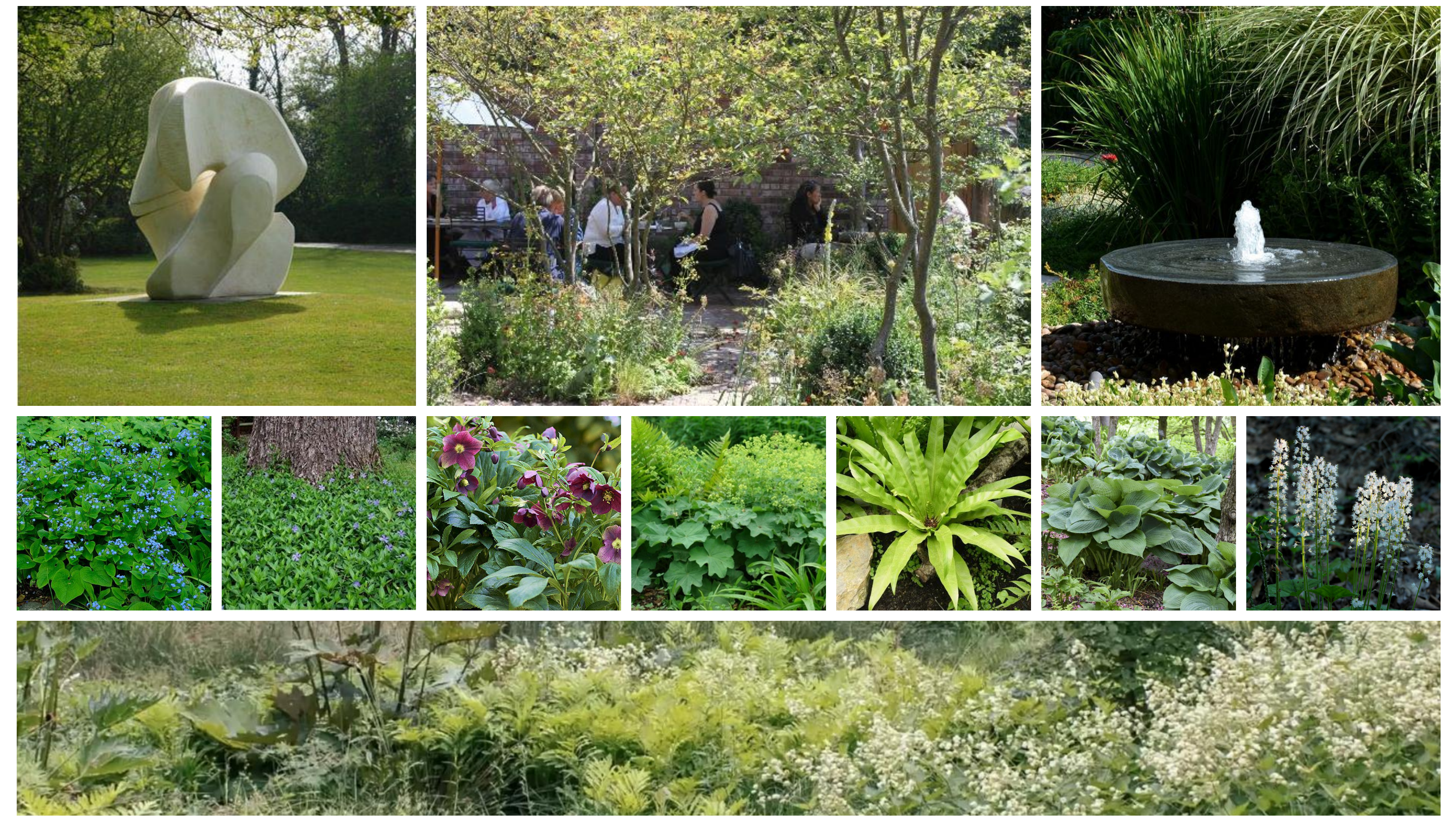
Kert és művészet