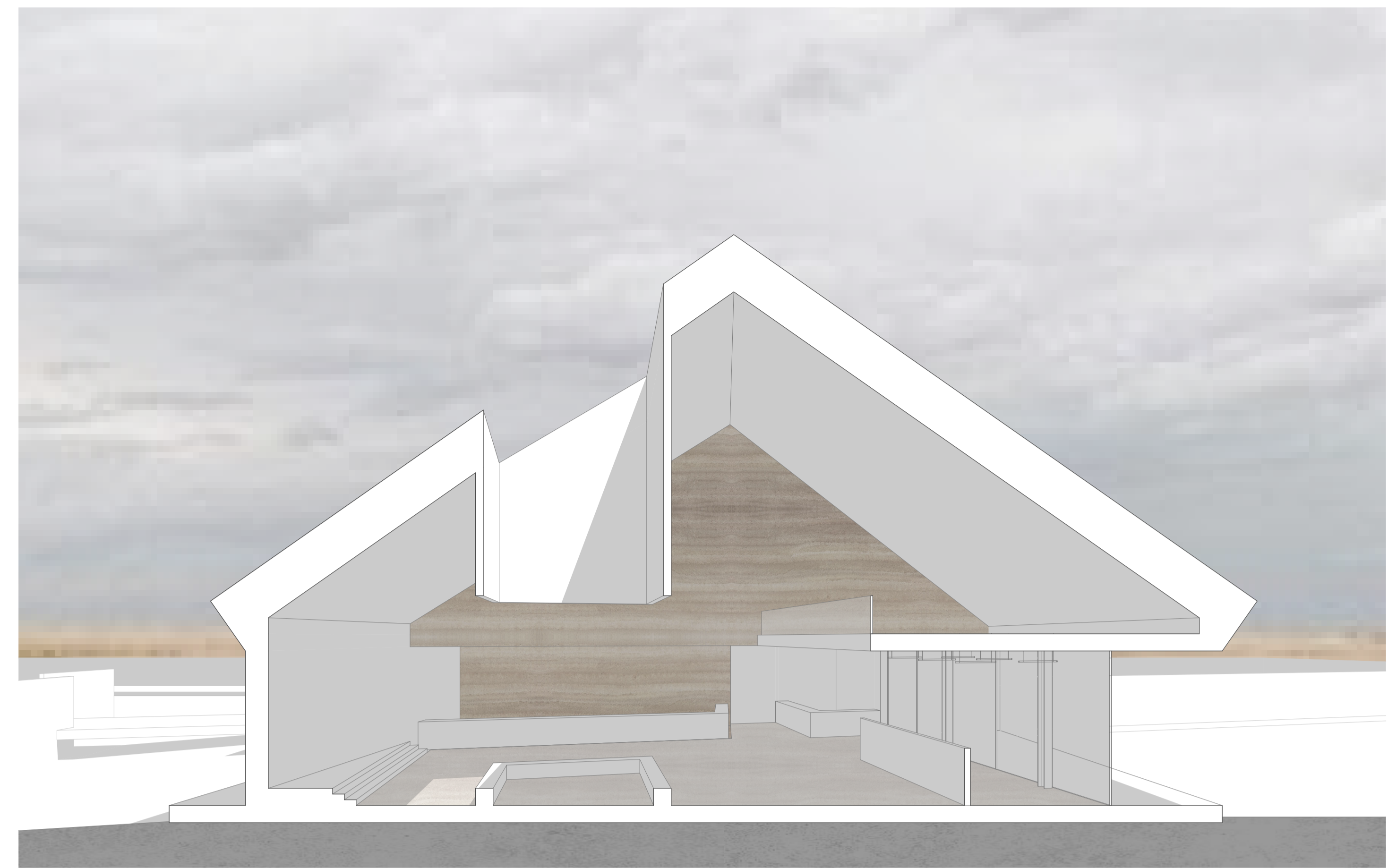
FOGADÓ ELŐTÉR METSZET