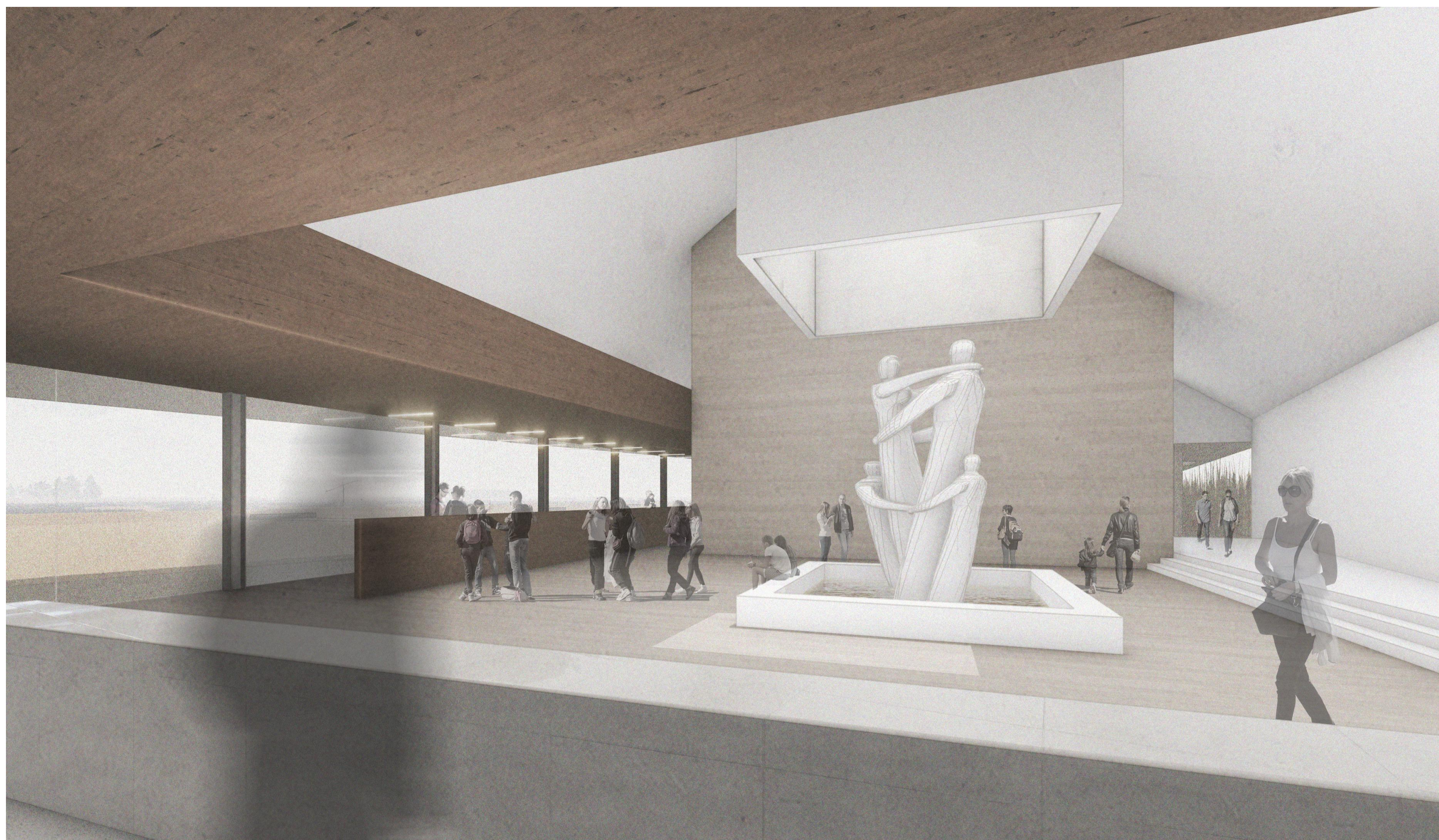
FOGADÓ ELŐTÉR BELSŐ LÁTVÁNY