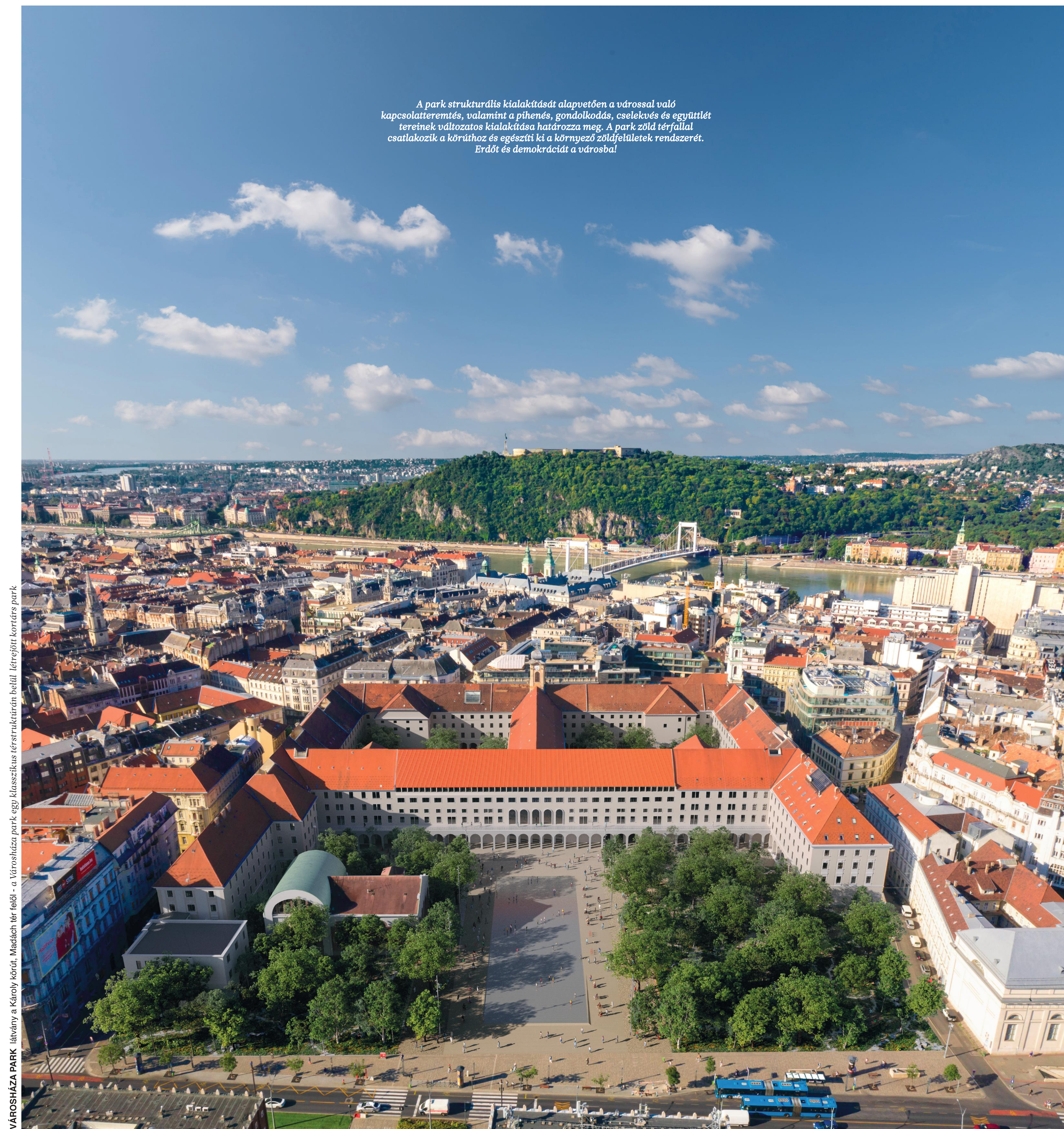
VÁROSHÁZA PARK látvány a Károly körút, Madách tér felől - a Városháza park egy klasszikus térszerkeztől belülről létrejött kortárs park