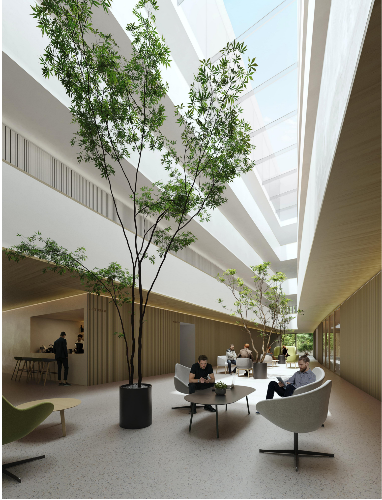
↑ az átrium tere a főbejárat felől, balra a bár és az átkötés az étterem felé, jobbra a recepció és a konferenciatermek