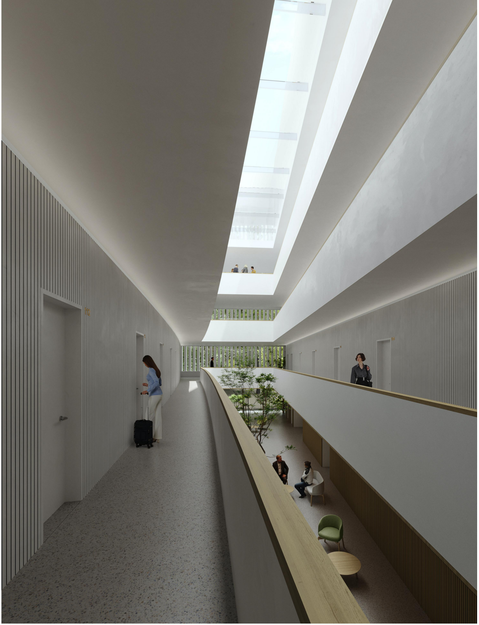
↑ a filigrán, üveggerendákkal gyémálított üvegtetővel fedett átrium tere az 1. emeleti közlekedőről a bejárat felé nézve

A tervezett szálloda alaprajza alapvetően észak-déli tengelyű, különböző szélességű traktusokból áll. A fő alaprajzi szerkesztést az építési hely északi és déli határa között kifeszülő egyenes és enyhén ívelt vonalak sorolása, azok finoman hangolt kompozíciója szervezi. A földszintes éttermi traktust követi a két szobákat tartalmazó szállodai szárny és a közöttük lévő, enyhén nyíló, trapéz alaprajzú átrium.