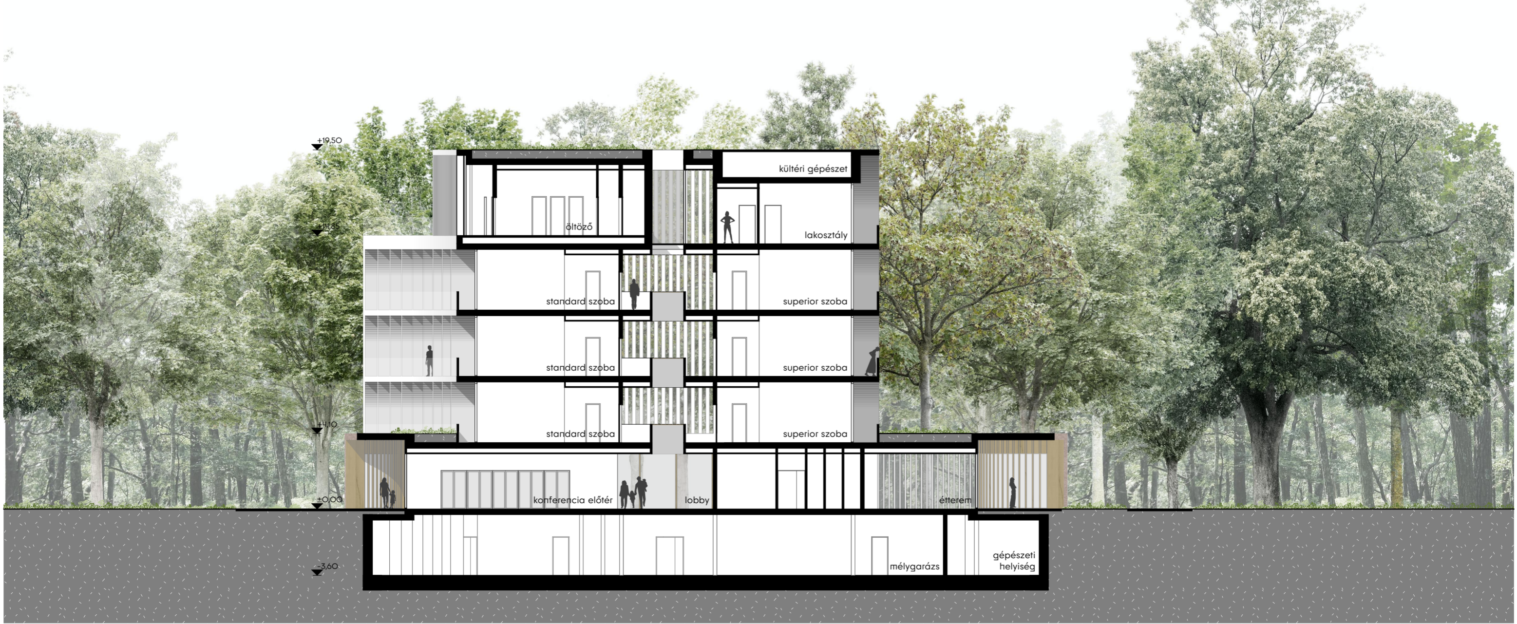
↑ MO2 keresztmetszet - m 1:200