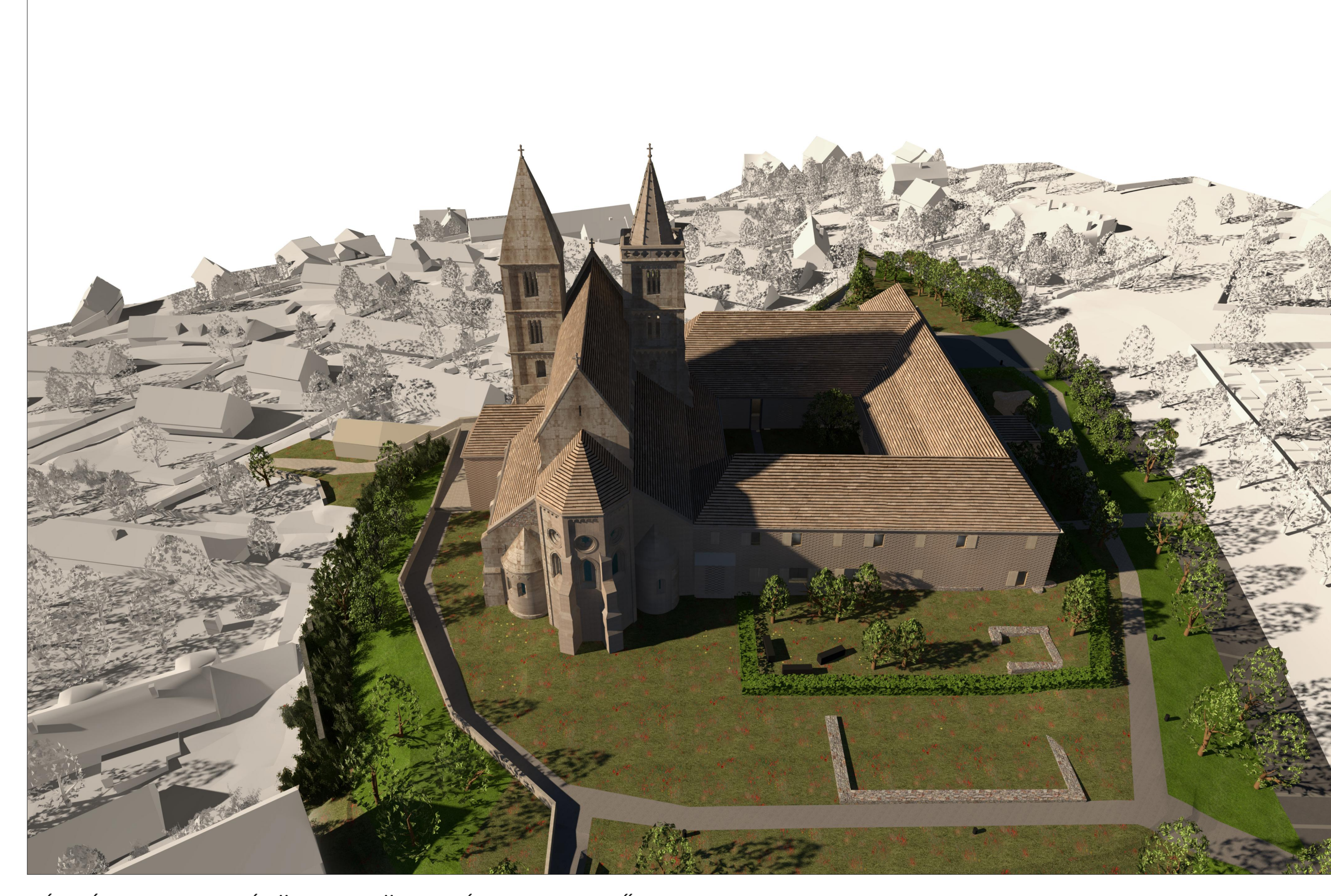
LÁTVÁNYTERV- AZ ÉPÜLETEGYÜTTES ÉSZAKKELETRŐL