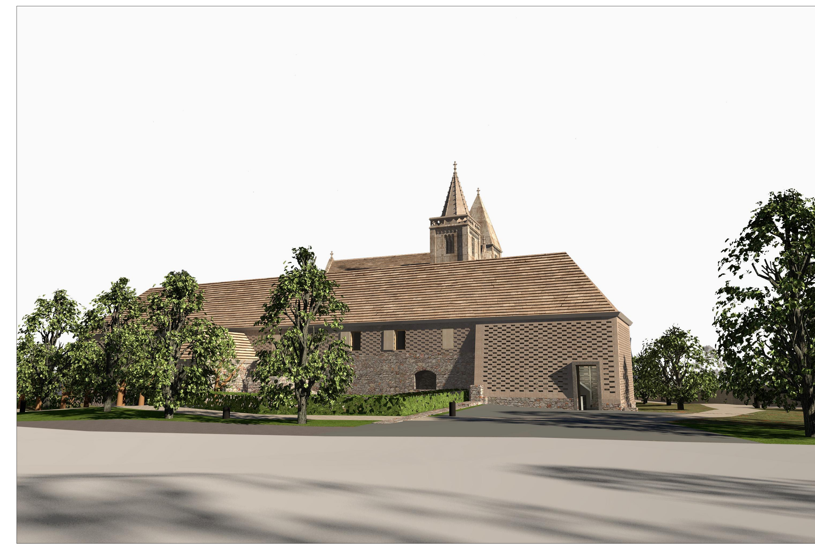
LÁTVÁNYTERV- A LÁTOGATÓKÖZPONT BEJÁRATA