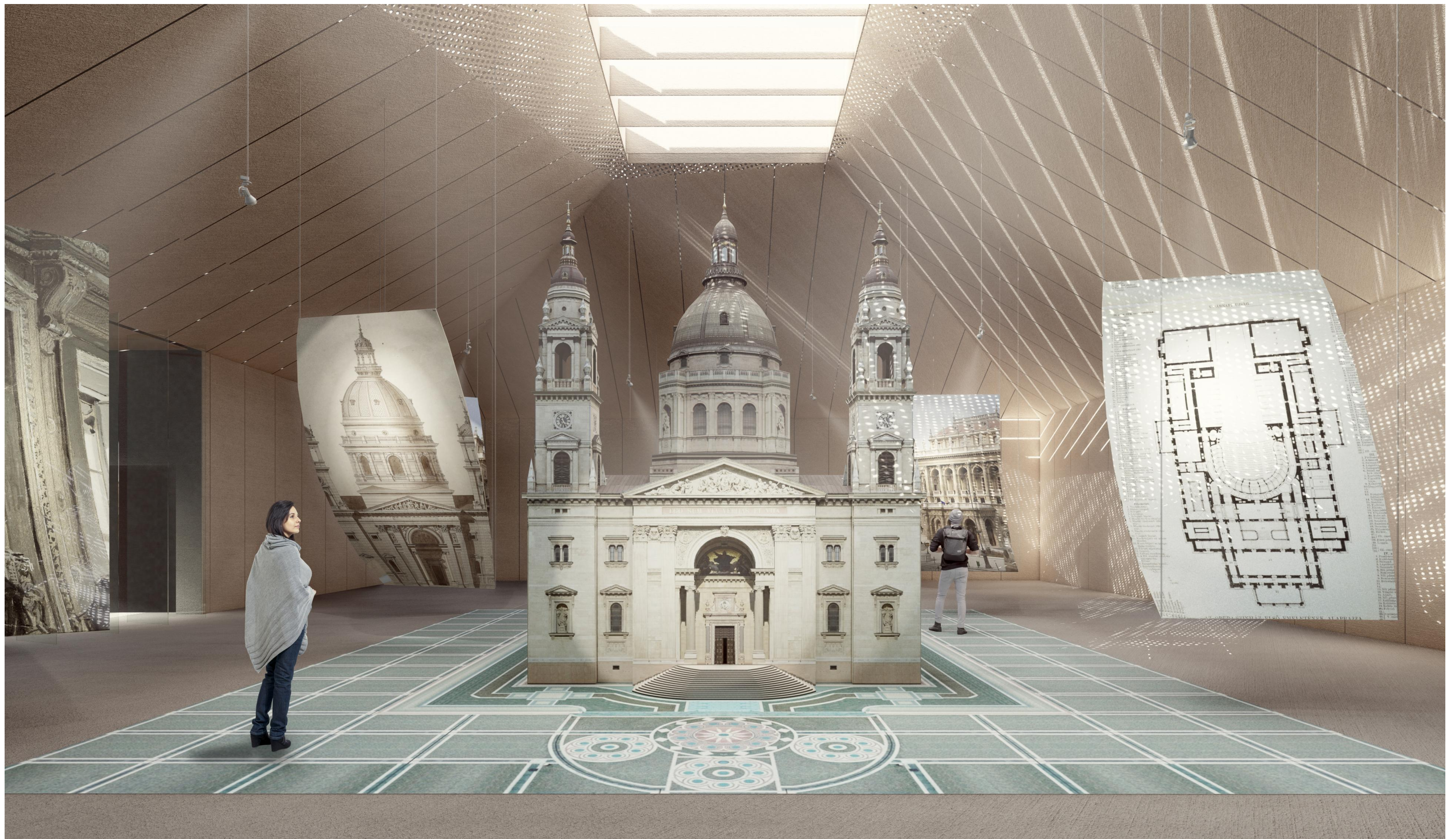
m = 1:250