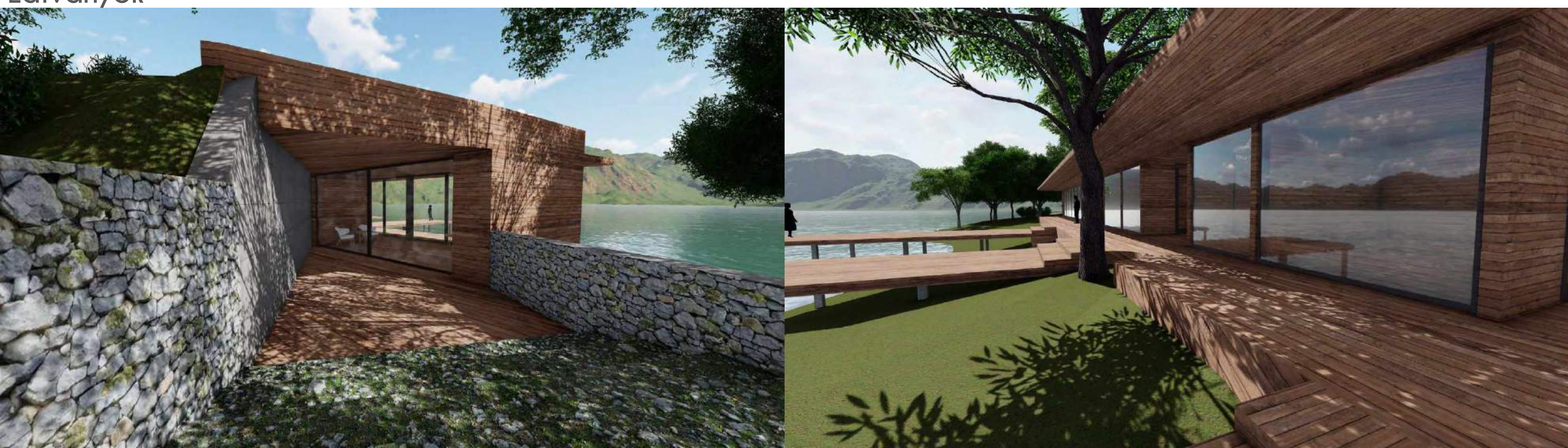
Keleti Homlokzat M1:100