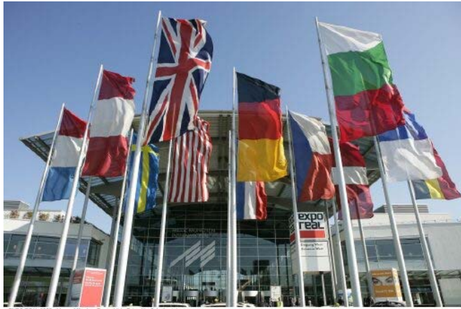
EXPO REAL, 2006 - Messe München Pressbild - Foto: Alexander Hoffmann