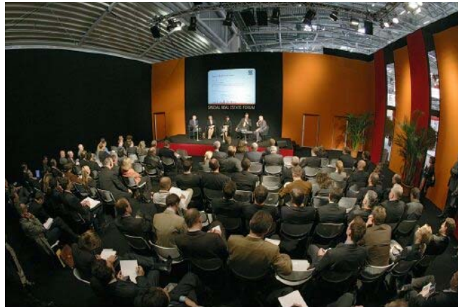
EXPO REAL 2005