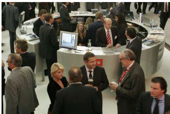
EXPO REAL 2005 - Moser München Pressebild - Foto: Daniel Stevanovic