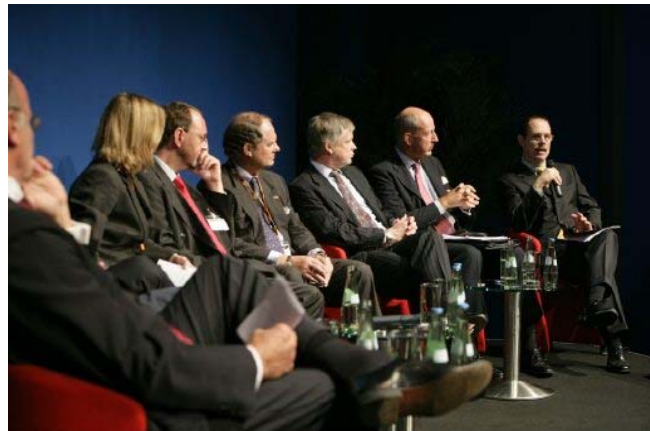
EXPO REAL, 2009 - Messe München Pressfoto - Foto: AxelSchubert.de

A rendezvények nem nyitottak a nagyközönség számára, a rendezvények csupán a regisztrált ingatlanfejlesztő-professionalisták részére hozzáférhető.