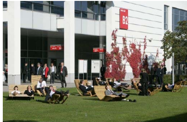
EXPO REAL 2006 - Messe München Prozessbild - Foto: AlvaGörhambert.de

Mindez együtt biztosítja, hogy amellett hogy a REevoluto Budapest 2006 ingatlanvásár valóban potens projektek, és potens befektetők találkozója legyen, egyben a kapcsolatok építésére és ápolására is lehetőséget nyújtson, ezáltal a közép- és délkelet-európai projektfejlesztés és a projekt és ingatlanfejlesztő professzionisták platformjává válhasson.