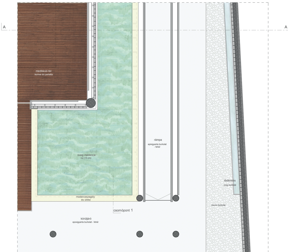
Alaprajzi részlet M 1:50