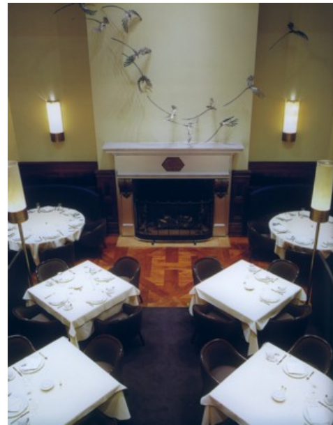
Dylan Hotel, New York, étterem

A kápolna visszanyeri egykori funkcióját – ezzel együtt teljes belső rekonstrukcióját tervezzük.