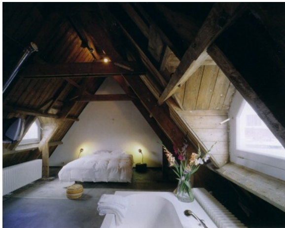
Lloyd Hotel, Amsterdam: tetőtéri szoba