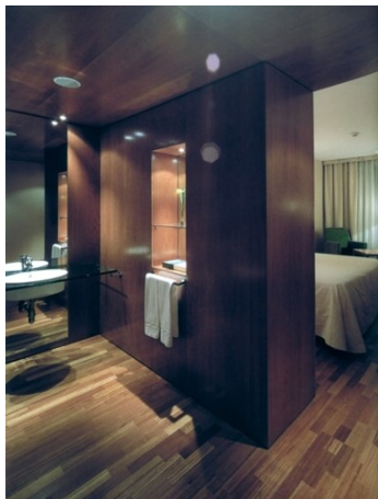
Hotel Aitana, Madrid

A szállodai szobák kialakításának elkerülhetetlen velejárója az egymásba nyíló térsorok megszüntetése, és a nagy szobák megosztása a fürdőszobák elhelyezése miatt. Az utóbbiak bútorszerű megfogalmazásával, a „ház a házban” formálás használatával jelezzük a beavatkozás utólagos voltát és – reményeink szerint – mérsékeljük annak brutalitását.