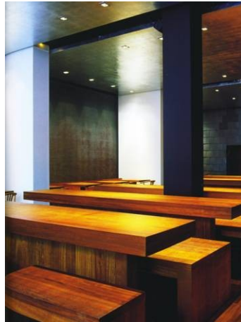
El Japonés étterem, Madrid

A ház földszintjén a DK-i sarokszoba egykor a férfiak dohányzója volt. Szerencsés, ha az új funkciók rímelnek a régiekre: a tervezett szivarszoba berendezése angolosan konzervatív, „Gentlemen Room”. A faragott famennyezet helyreállításra kerül.