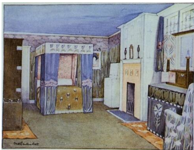
Hálószoba, dekorációs séma, Baillie Scott 1900

A neogótikus belső díszítések előtt riadtan áll korunk belsőépítészete: a súlyos, sötét kazettás falfelületek, a sok faragás valójában elég nyomasztóak. Ennek folytatása elképzelhetetlen 2008-ban: a próbálkozás a neo-neogóttal eleve kudarcra van ítélve. A középkor zamatát jobban élvezzük egy nem sokkal későbbi interpretációban. Az 1860-as évektől induló, William Morris és John Ruskin nevével fémjelzett, az eklektika kritikáját megfogalmazó Arts and Crafts mozgalom szintén a középkorból merített ihletet. A ma már a modernizmus előfutáraként jegyzett irányzat derűs, archetipikusan formált belső tereivel közel áll a ma emberéhez is.