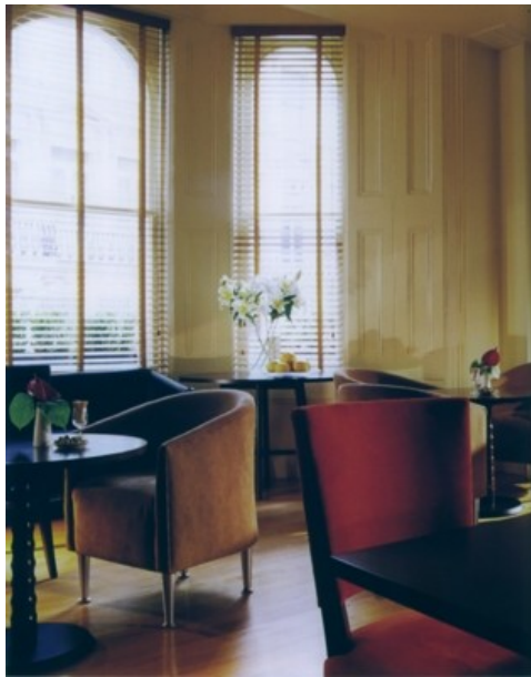
Kensington House Hotel, London, foyer