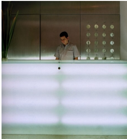
Hotel Habita, Mexico, recepció

A front office berendezése: korszerű munkaállomások és irattárolók.