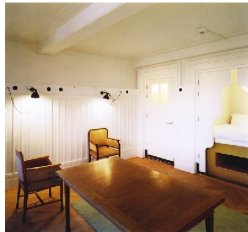
Lloyd Hotel, Amsterdam: szobabelső alkóvos ágygal