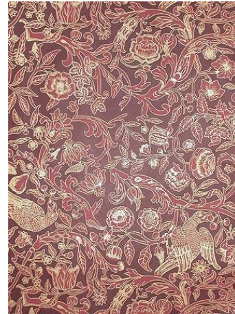
Autentikus Arts and Crafts tapéták a Cole and Son gyár palettájáról.

Az egyes helyiség-csoportokkal szemben támasztott funkcionális követelmények és azok javasolt megoldása