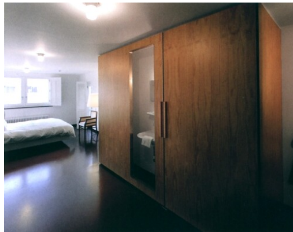
Lloyd Hotel, Amsterdam: fürdőszoba mint bútordarab

A földszinti közösségi vizesblokkok az északi folyosó mentén kapnak helyet, kihasználva a három-traktusos szakasz belső helyiségeit.