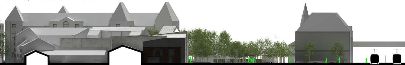
keleti irányú keresztmetszet 1:250