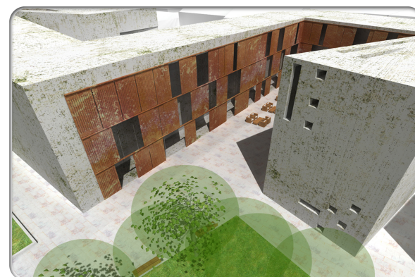
inkubátor ház látványtervek