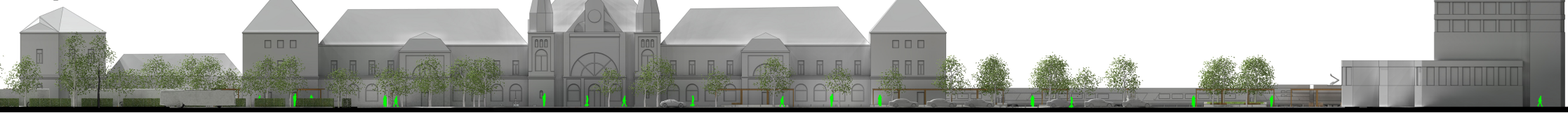
déli irányú hosszsmetszet m 1:250