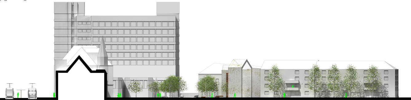
nyugati irányú keresztmetszet m 1:250