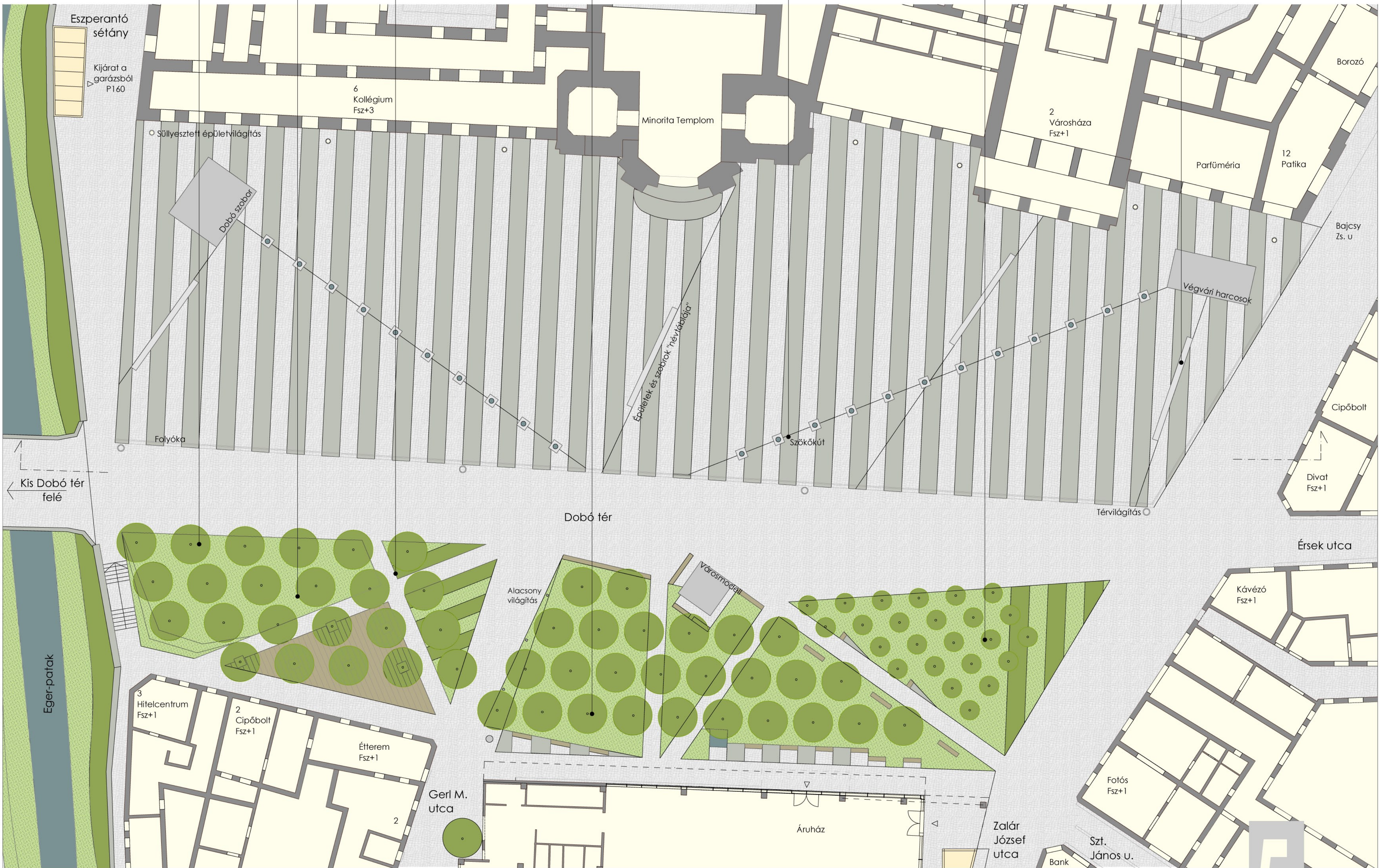
DOBÓ TÉR M1:200