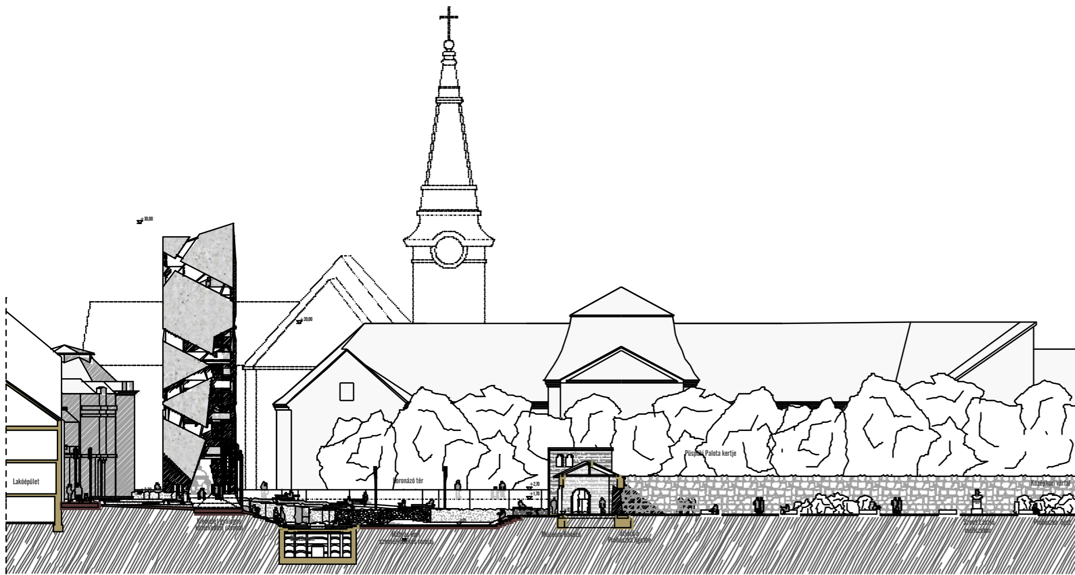
KERESZTMETSZET (az Oszsáriumon keresztül)