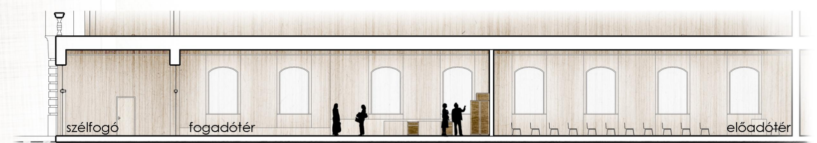
B-B falnézet M 1:200