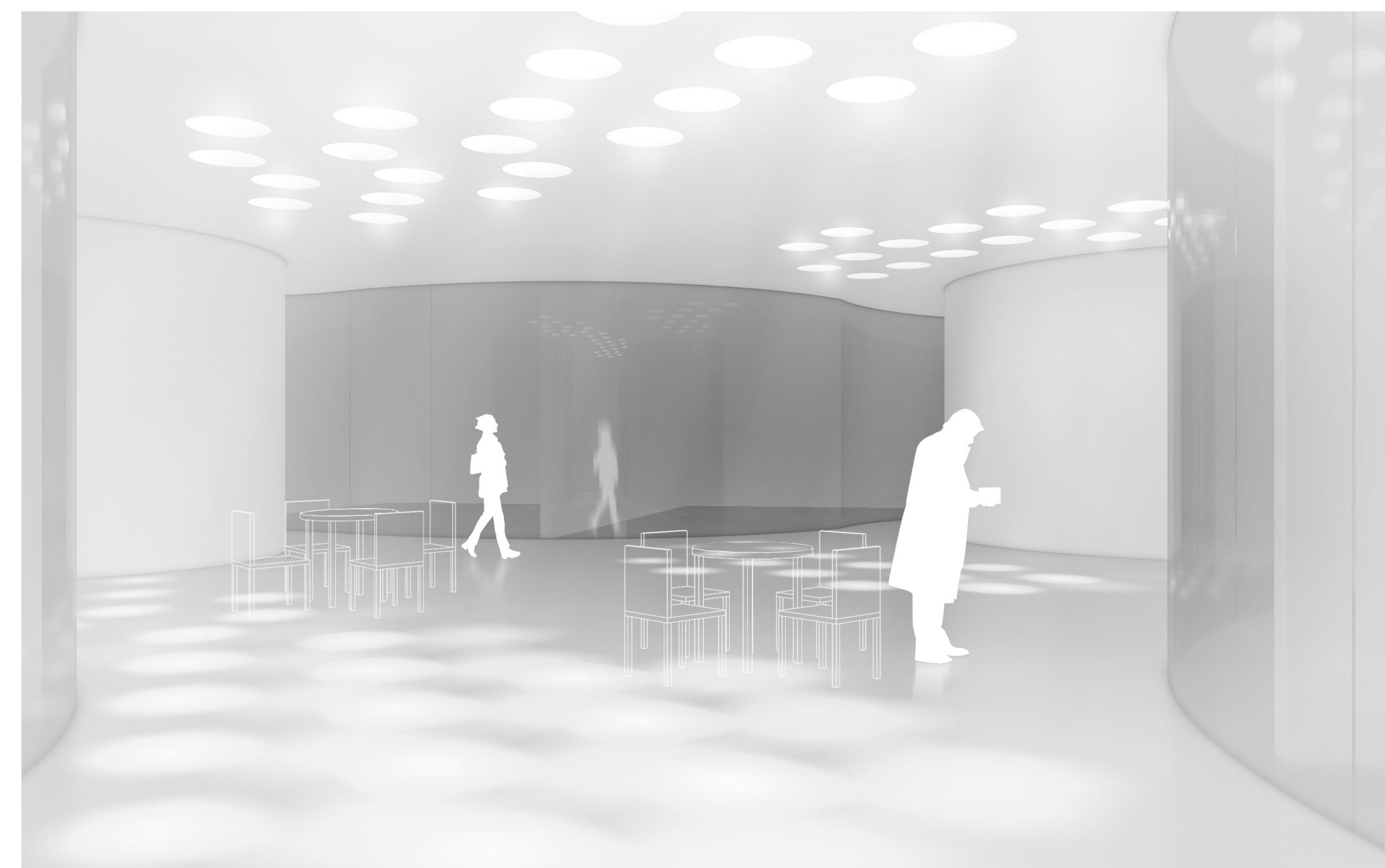
a restaurátor műhely közösségi terei kellemes munkakörnyezetet biztosítanak