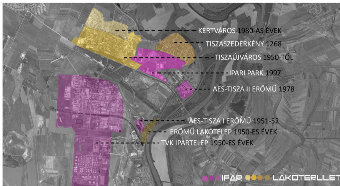
LAKÓ ÉS IPARTERÜLETEK MEGOSZLÁSA