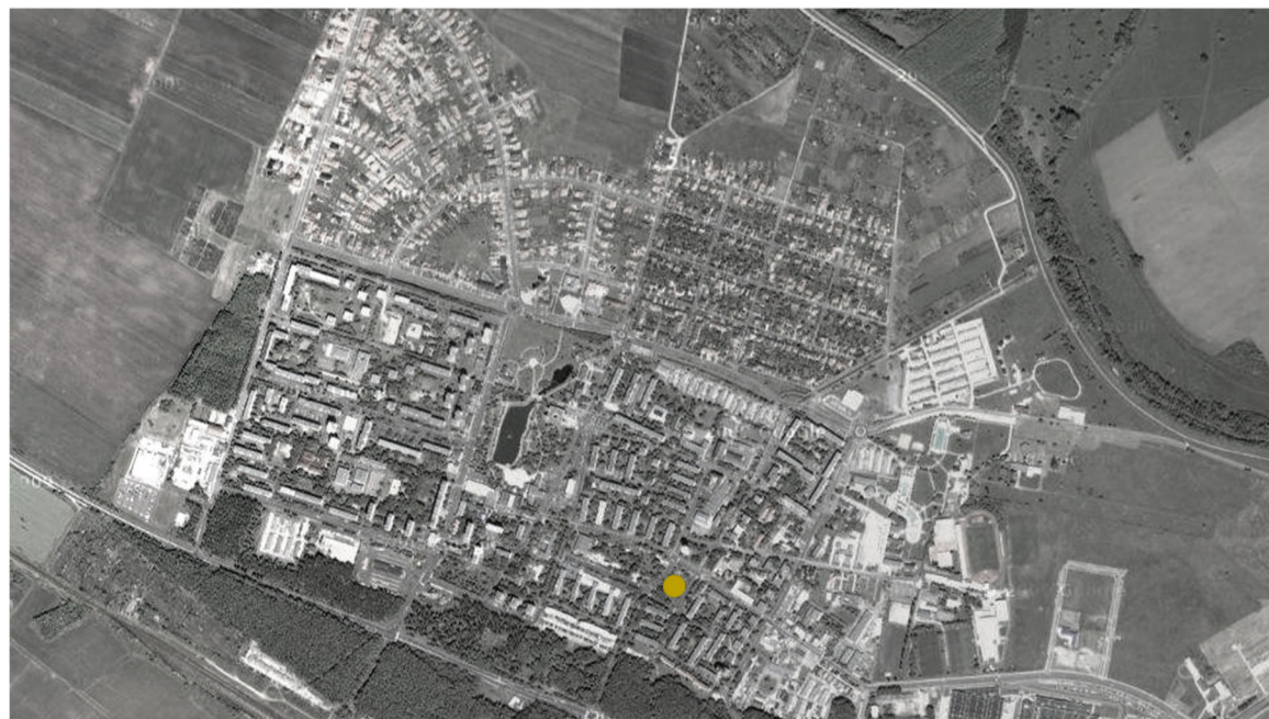
TERVEZÉSI HELYSZÍN A VÁROSBAN