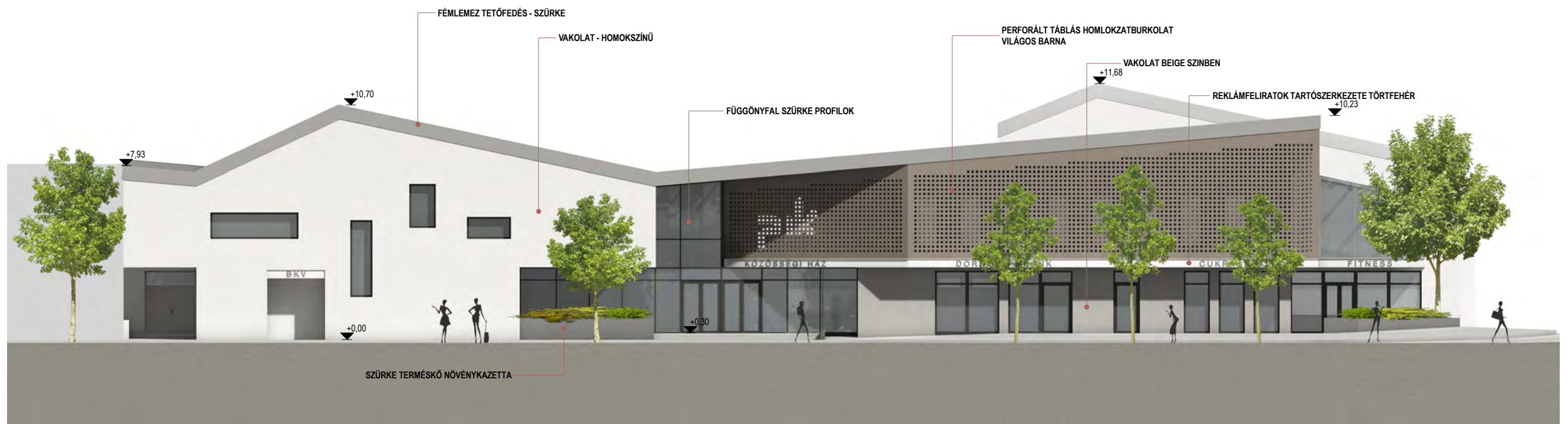
DNY-I /VASÚT U.-I/ HOMLOKZAT