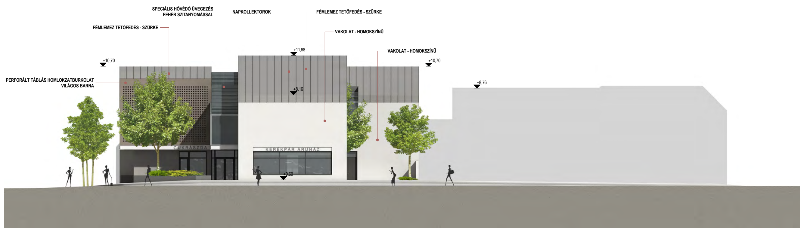
DK-I /NEMES U.-I/ HOMLOKZAT