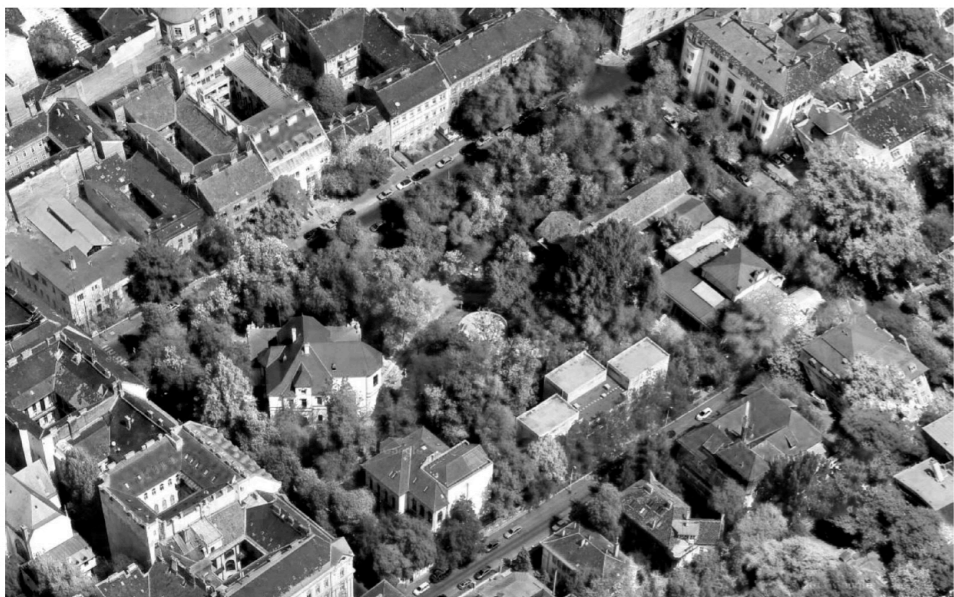
Budapest VI. kerület, Terézváros. A Bajza utca, Szondi utca, Kmetty György utca és a Munkácsy Mihály utca által határolt terület

Felépítése, helyiségei, szerkezete az intermédiatanszék igényeit nem tudja kielégíteni. A tanszék számára az Epreskert közelsége ideális, hiszen tevékenysége a társadalmi integrációjáról is szól. Fontos a változó, kreatív környezet. Az Epreskert a villaszerű pavilonjával ideális helynek ígérkezik. A "kert" jelenleg otthont ad a festő és szobrászművészeknek, illetve a dizsjet- és jelmeztervezőknek. jelenlegi intermédiatanszék