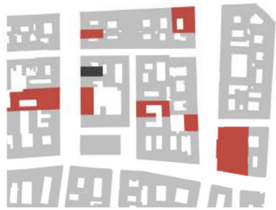
1. Kulturális intézmények

A kiállítás 1992-ben egy átalakított garázshelyiségben nyitotta meg kapuit, majd 2000 novemberében költözött át az azóta is állandó helyére. A tárlat eredetileg 18 dobszettel indult, az elmúlt 10 évben azonban mind méretében mind szakmai összetételében világszínvonalúvá vált. A mai Dobmúzeum mintegy 80 teljes dob felszerelést és még számos önálló darabot mutat be a látogatók számára. A jelenlegi épület által biztosított keretek így már nem elégségesek a megnövekedett igények kielégítésére, az állandó helyhiány miatt mára alkalmatlanná vált a kiállítás befogadására, múzeumi funkciók betöltésére. A zsúfoltság a tárlat volumenéhez méltatlan körülményeket idéz, és ugyanakkor a kiállítási darabok megismerését is ellehetetleníti.