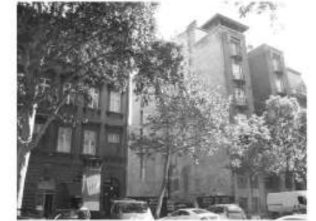
Budapest VI., Nagymező utca 5.

A kiállítás 1992-ben egy átalakított garázshelyiségben nyitotta meg kapuit, majd 2000 novemberében költözött át az azóta is állandó helyére. A tárlat eredetileg 18 dobszettel indult, az elmúlt 10 évben azonban mind méretében mind szakmai összetételében világszínvonalúvá vált. A mai Dobmúzeum mintegy 80 teljes dob felszerelést és még számos önálló darabot mutat be a látogatók számára. A jelenlegi épület által biztosított keretek így már nem elégségesek a megnövekedett igények kielégítésére, az állandó helyhiány miatt mára alkalmatlanná vált a kiállítás befogadására, múzeumi funkciók betöltésére. A zsúfoltság a tárlat volumenéhez méltatlan körülményeket idéz, és ugyanakkor a kiállítási darabok megismerését is ellehetetleníti.