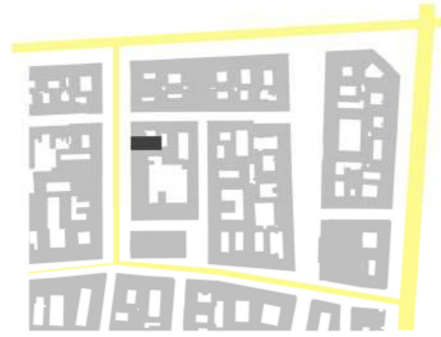
2. Közlekedési infrastruktúra

Zeneakadémia, Gyermekkönyvtár, Tűzraktár, Zeneiskola, Írók boltja, Radnóti Színház, Ernst Múzeum, Kamaraszínház