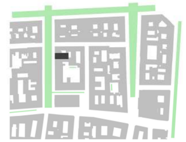
4. Zöldterület, növényzet

Belvárosi zárt sorú beépítés, általában kicsi udvarral, széles utcakeresztmetszettel