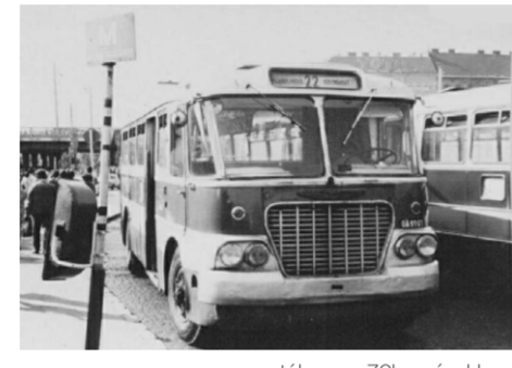
autóbusz a 70-es években