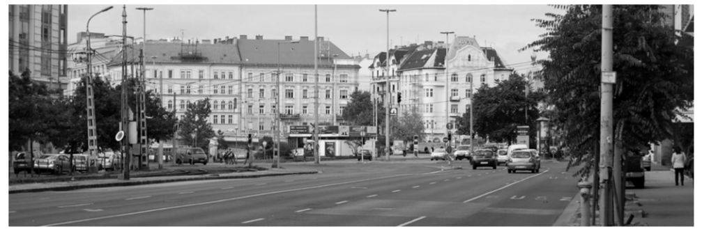
Wéberly és Sorokási út felől