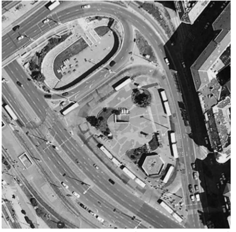
tervezési terület: buszforaklő