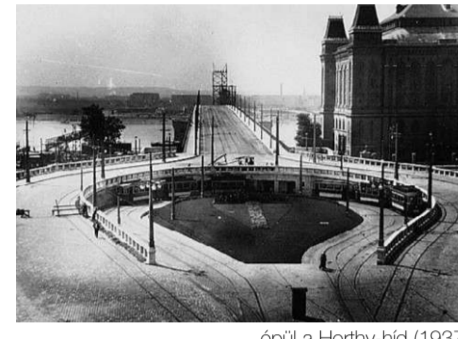
épül a Horfny-híd (1937)