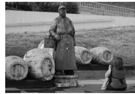
a Boráros szobrász (1983)