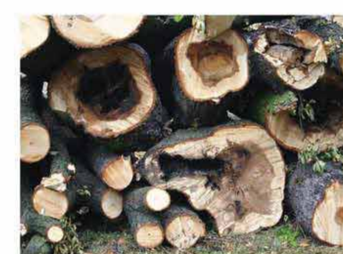
A vadgesztenye fasor felújítás előtt és után/ The horse-chestnut vista before and after rehabilitation