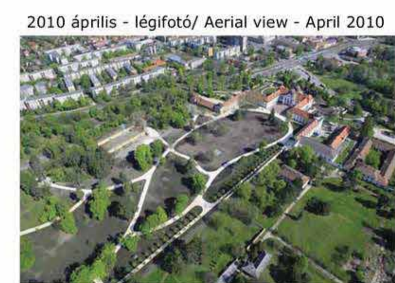
2010 április - légifotó/ Aerial view - April 2010