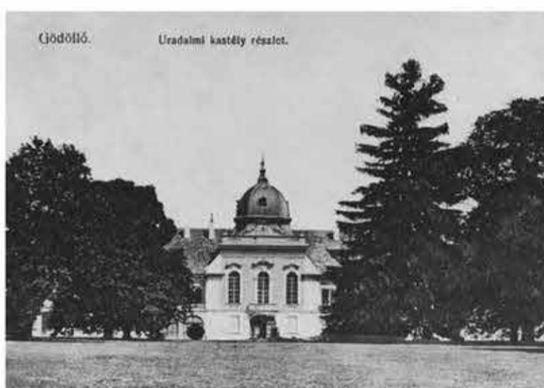
A kert fő tengelye/The main axis of the garden - 19. század vége/the end of the 19th century