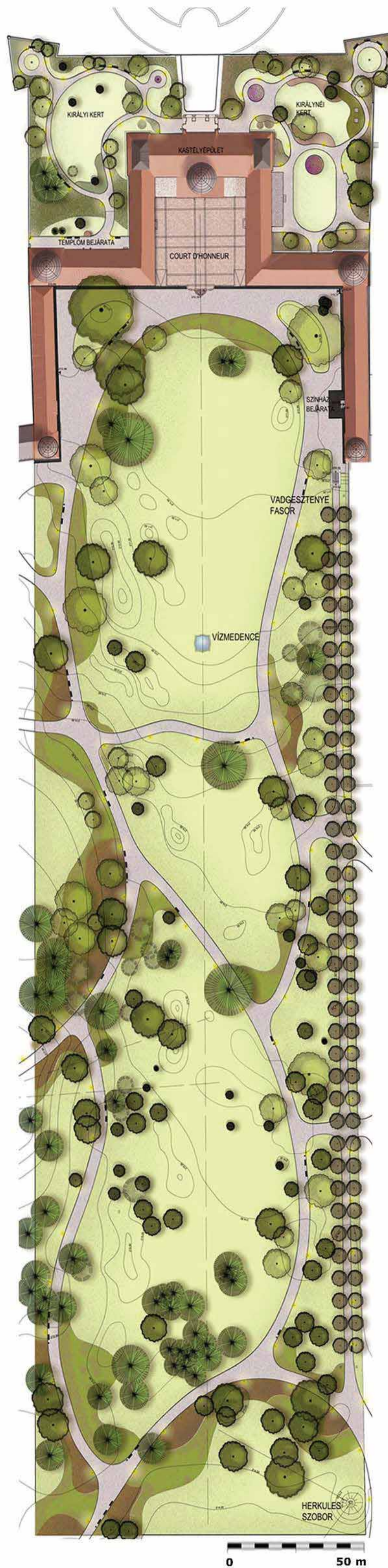
Az I. ütem kertépítészeti részletterve: a központi kertrész/ Design detail of the I. schedule: the central area of the garden