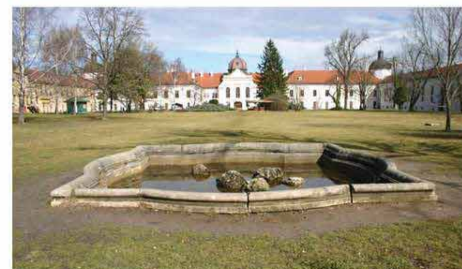
felújítás előtt/before rehabilitation