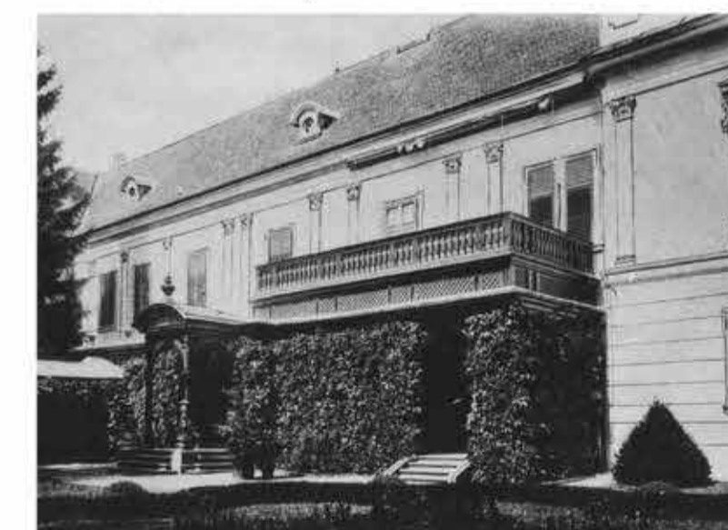
A pavilon és környezete a 19. század végén és a felújítás után/ The pavilion and their surrounding area at the end of the 19th century and after rehabilitation.