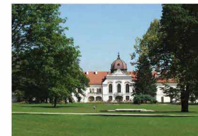
felújítás után/after rehabilitation