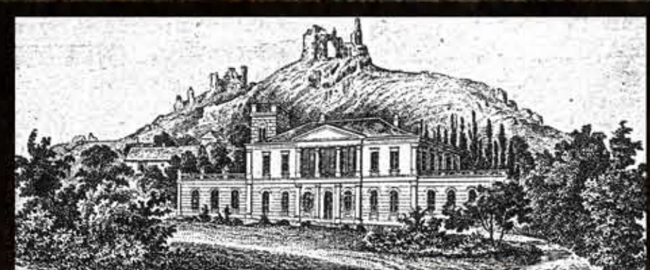
A kastély az átépítés előtt, XIX. sz. végi metszet

Az Esterházyak nagy bizonyossággal a harmadik felmérésen ábrázolthoz hasonló, de annál elhanyagoltabb, felújításra szoruló birtokot vettek meg 1910-ben. Gróf Esterházy Pál (1861-1932) a XX. század eleji Magyarország leggazdagabb birtokosa volt, 1910-ben a teljes Puteani birtokot megvásárolta: 589 hold földet és csaknem 3000 holdat a Balatonból, majd a birtok történetének legfontosabb építkezéseibe kezdett.