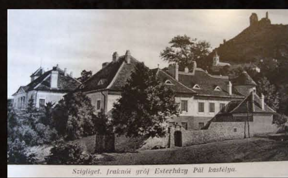
A kastély déli homlokzata a várral, képeslap, 1930k