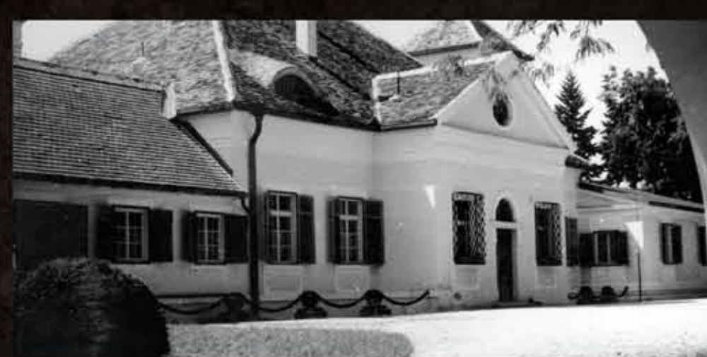
A kastély hátsó homlokzata