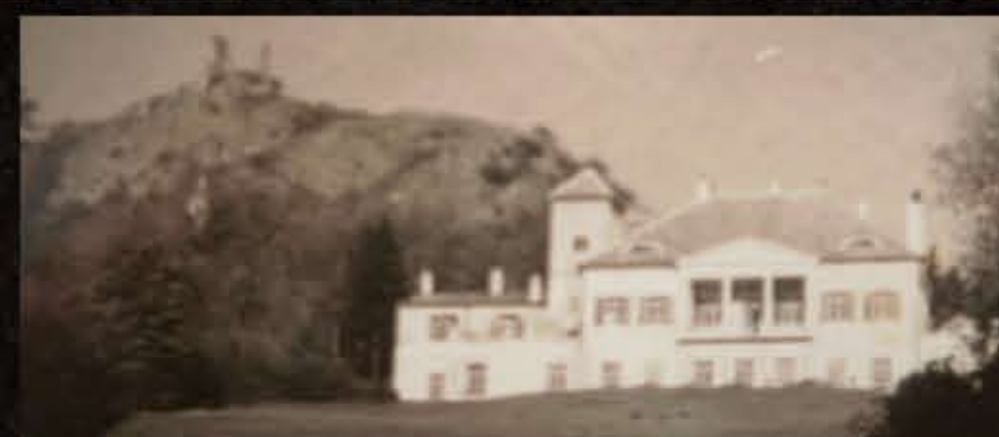
A kastély főhomlokzata

A gróf 1910-ben vásárolta meg a birtokot, majd 1916-ban hozzájárult a kastély teljes átépítéséhez. Az erős építészeti átalakításokkal kialakult a mai, egységes formája. Ezen munka eredményei a teraszok, a tornyok, a manzárdok, a tetőtömegek és a homlokzati kép kialakítása. Az épületben a népi barokk és a klasszicista részek jól elkülönülnek.