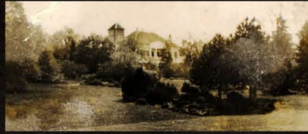
A kastély a sziklakerttel, 1912k

Mivel a birtok megvásárlása és átalakítása után férje inkább a család uszai birtokán tartózkodott, a grófné elképzelései erősen befolyásolták a kertben bekövetkezett további változásokat. A rosarium és a filagória az északi kertrész legfőbb látványosságai, az ide vezető burkolat egy felirat alapján pontosan datálható 1937-re