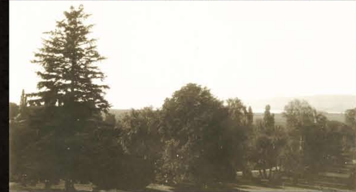
A fő látványtengely a kastélyból, 1912k