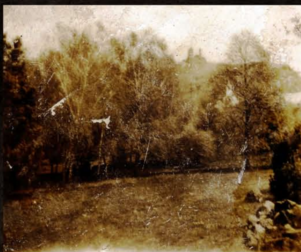
A szigligeti vár látványa az egykori kriketpályáról, 1912k

A gróf az akkor még a kastély mögött vezető utat a keleti kőkerítésen kívülre vezettette, és 1913-ban megépült a mai főbejárata, a Bujtás-kapu. A kert alapvetően átalakult, hiszen a szomszédos telket is hozzácsatolták, egy részén díszparkot, másik részén zöldesget és gyümölcsösöt kialakítva. A bővítéssel a díszkert területé duplájára, nagyjából 6 hektárra nőtt. A kert keleti oldalán, a kibővített díszpark keleti határa mentén támfalat építettek védelmi szempontokból. A nyugati oldalon természetes határként a Tapolca-patak szolgált. Ekkor telepítették az északi oldal véderősávját, amelynek fái ma már közel 100 évesek. A kert útvonalvezetése is ekkor készült el, a struktúra a 30-as évekre kialakult.