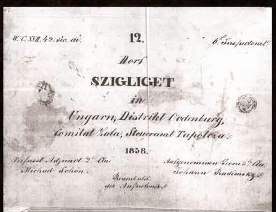
Az 1858-as kataszteri térkép határja, és a hozzá tartozó birtoklása