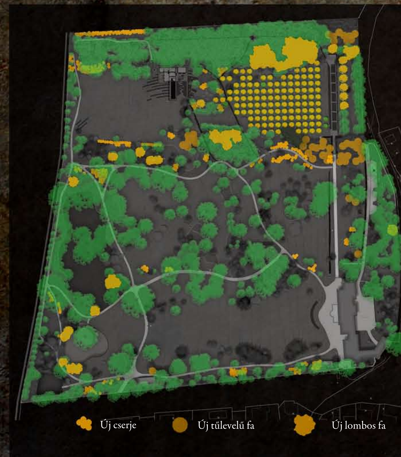
NÖVÉNYTELEPÍTÉSI TERV M=1:2000