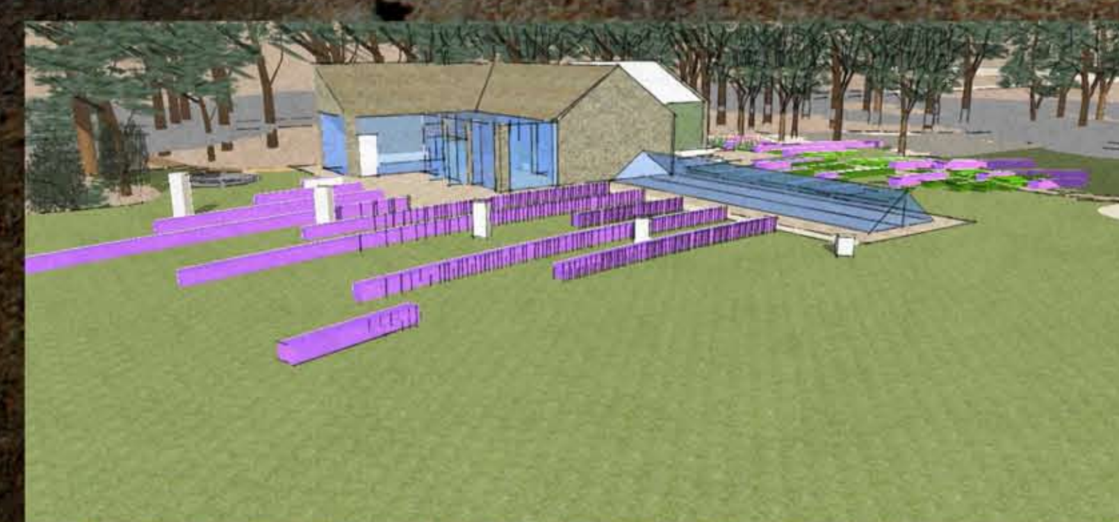
II. Átnézet az új épületrészről. Előtérben a levendula kiültetések és a terméskő oszlopsor