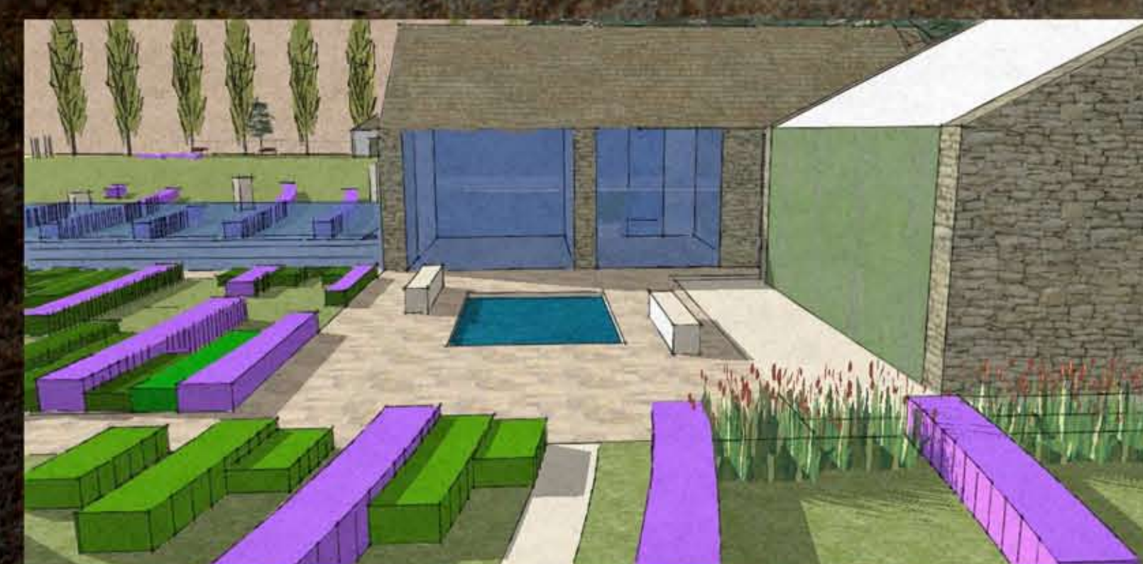
III. A felső udvar a medencével és a fűszerkerttel, háttérben a bejárati kapuépítmény