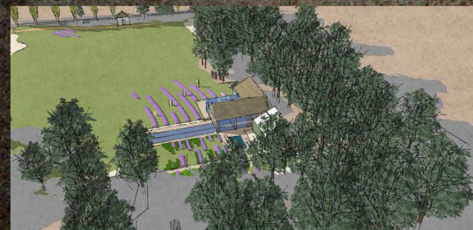
I. A nagyrét madártávlatból