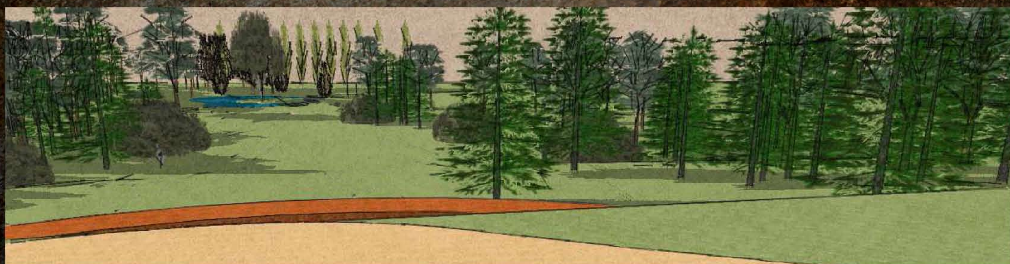
Látvány a kastélyról a szigetről - tervezett állapot

Az így felszabadult terület újragyepesítésével, a szegélyek rendbereléssel az egykori állapothoz hasonló átjárás jött létre. A kivágások után létrejövő, az ideális állapotoknak megfelelően fent látható látványterv tekinthető útmutatásnak az átalakításokhoz. A tő környékén élőcsoportok, valamint az itt egykor megtalálható szoliter füvek visszaillesztésével a történeti állapot visszahozható. A déli kőkerítés mentén húzódó erdőszéletről néhány faegyed szelektációjával a kastély teraszáról ismét láthatóvá válik a Balaton vízfelülete.