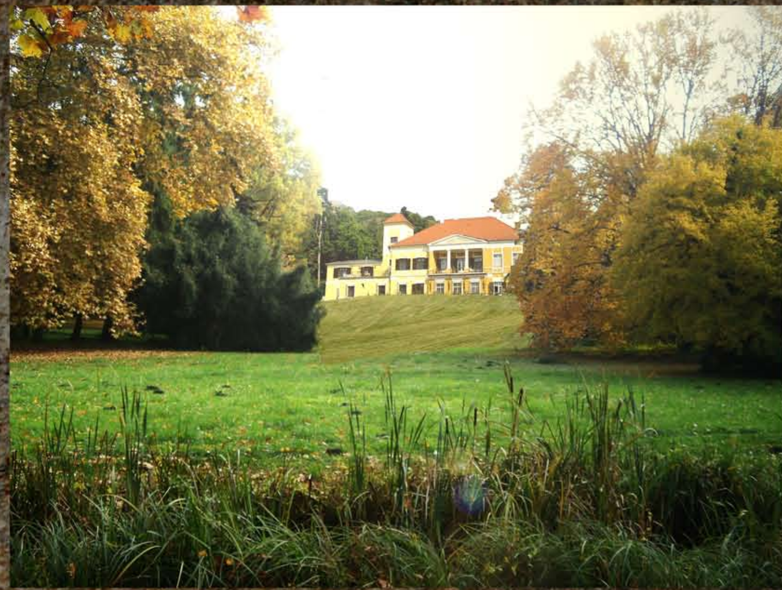
Látvány a szigetről a kastélyra - tervezett állapot