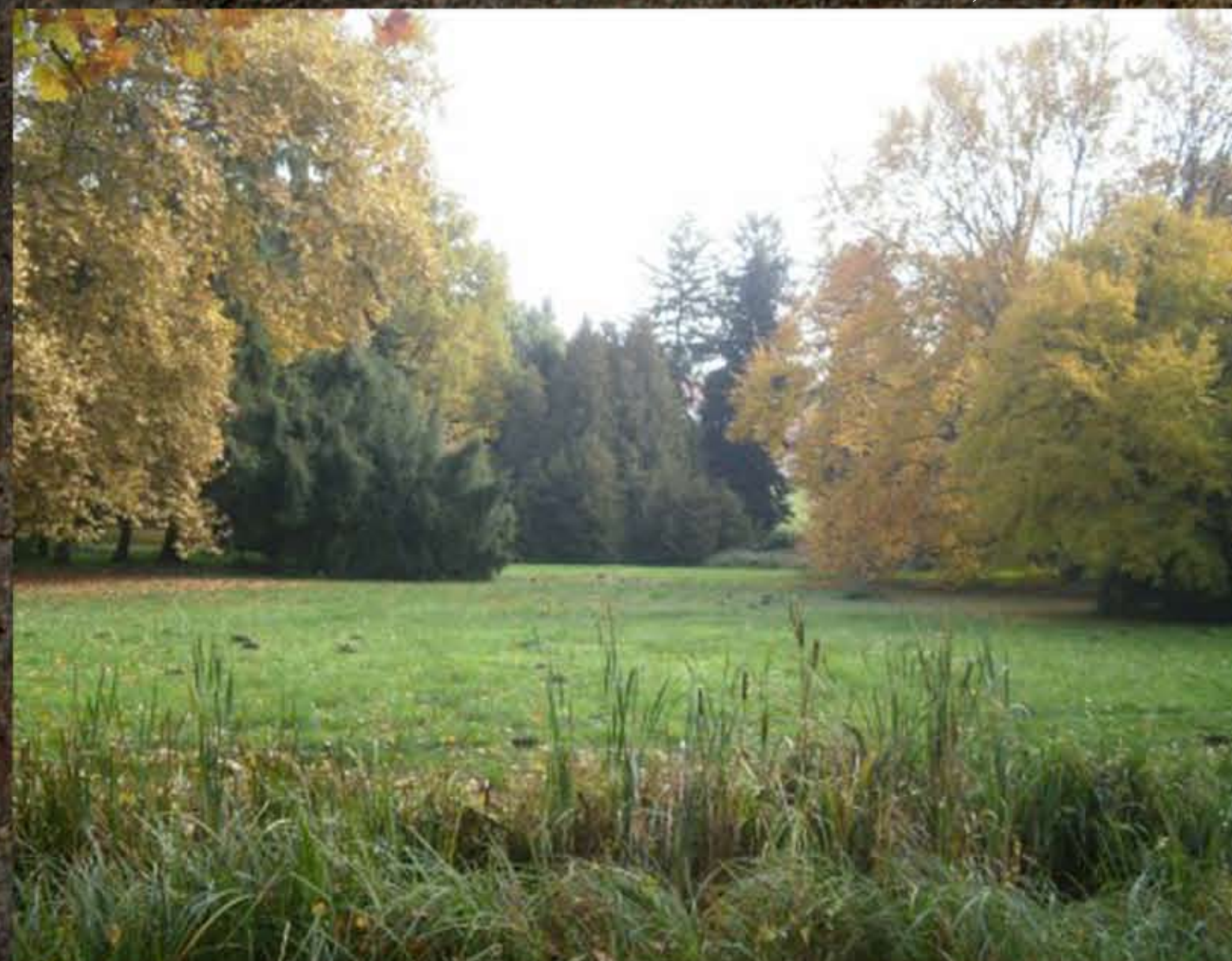
A látványengely ma