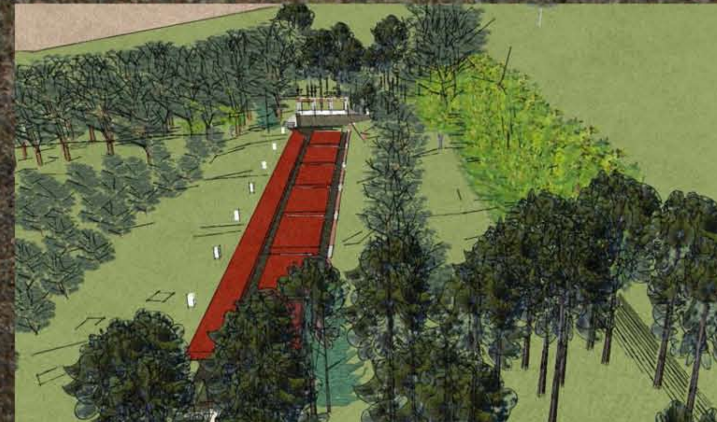
Átnézeti látványterv a rosariumból és környezetéről