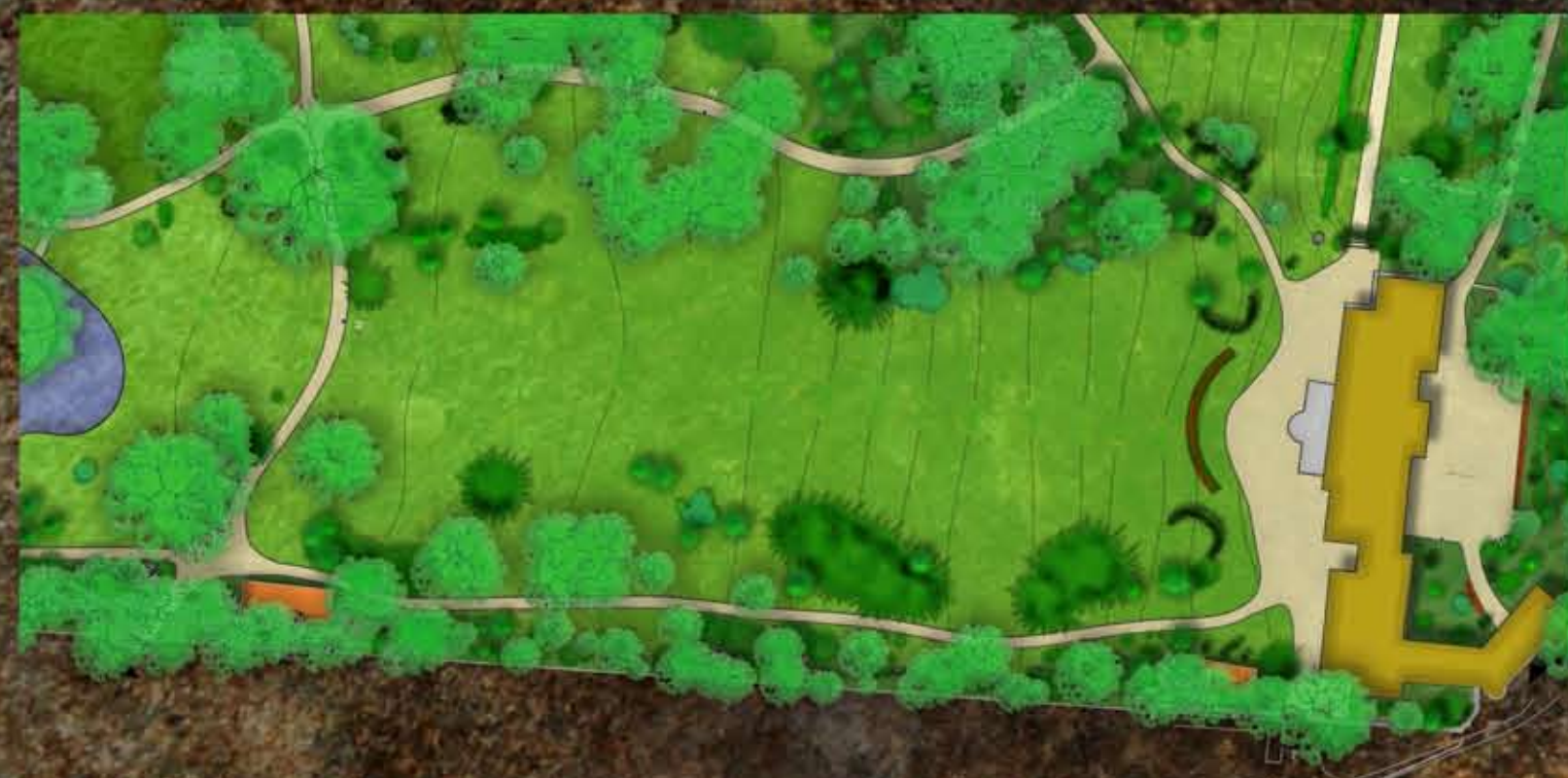
A fő vue tervezett állapota