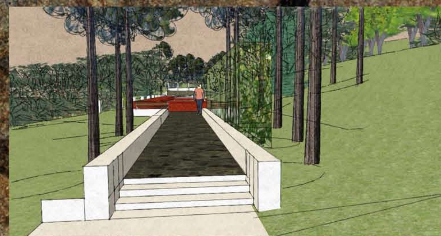
A rosarium sétánya a kastély irányából, háttérben a filagória