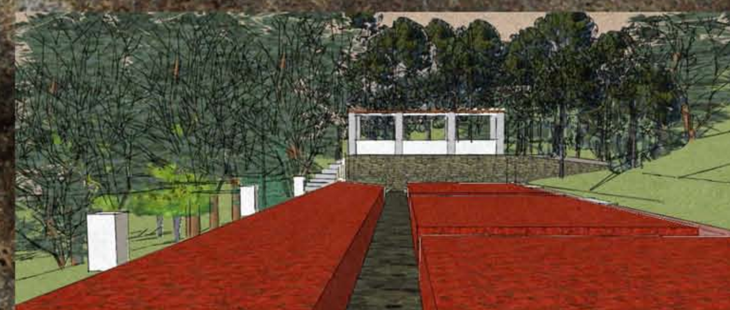
A filagória a rosarium sétányáról