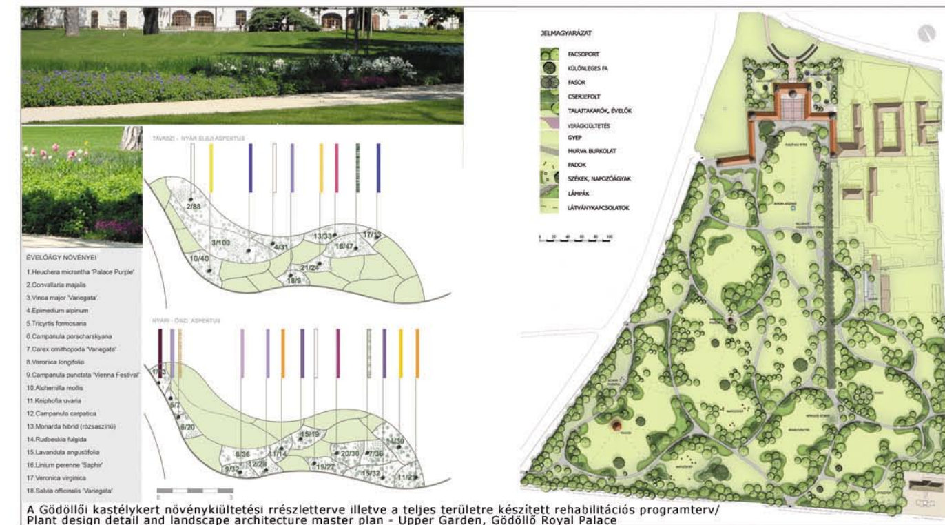
A Gödöllői kastélykert növénykiültetési részletterve illetve a teljes területre készített rehabilitációs programterv/ Plant design detail and landscape architecture master plan - Upper Garden, Gödöllő Royal Palace