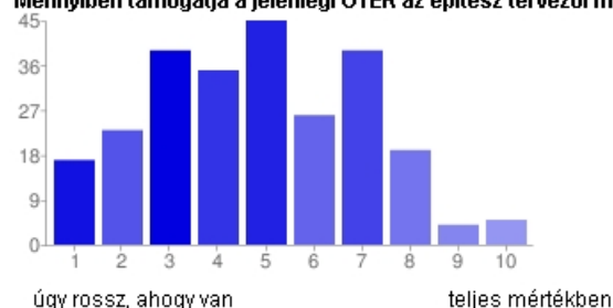
Mennyiben támogatja a jelenlegi OTÉK az építész tervezői munkát?