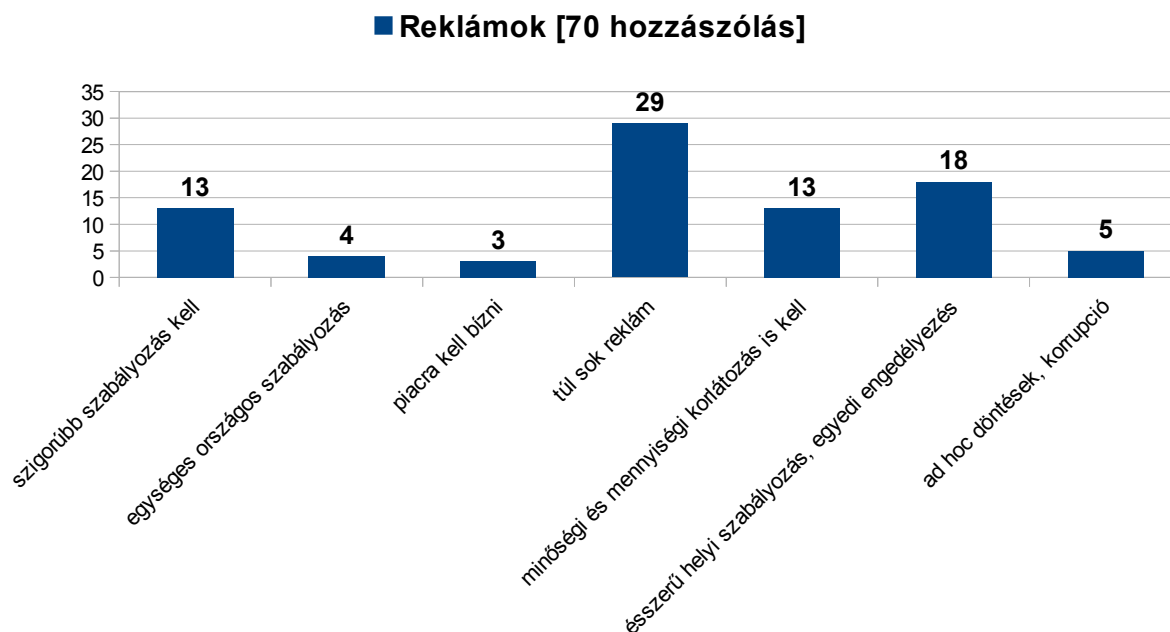
ábra 1. A reklámokkal kapcsolatban beérkező 70 szabadsoros vélemény tematikus csoportosítása

Az alábbiakban azokat a megjegyzéseket összegezzük, amelyeket a kérdőívet kitöltők a reklámokkal kapcsolatos kérdés utáni szabadsoros rovatba írtak. A kérdőív utolsó kérdésénél 252 válaszadó közül viszonylag kevesen, csak a ~27% érezte úgy, hogy a reklámokkal kapcsolatban további, kifejtendő álláspontja van. A reklámok megítélése – eltekintve 3 hozzászólótól – igen rossz.