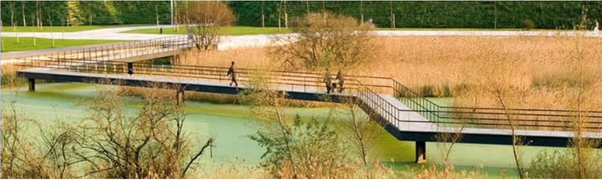
ELŐKÉP A TÓRENDSZER FELETT FUTÓ STÉGRENSZERRŐL