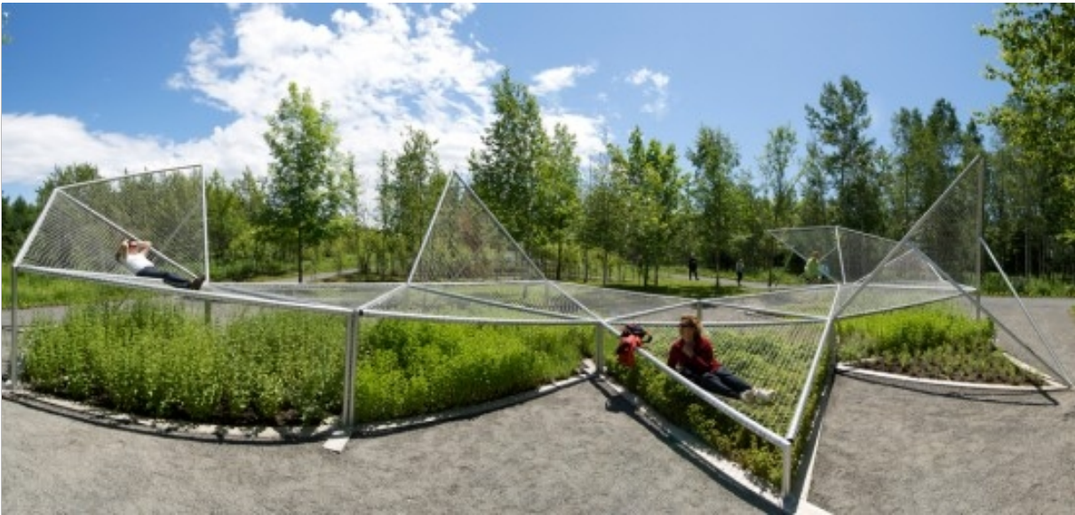
ELŐKÉP A HÁLÓS PIHENŐFELÜLETEKRŐL