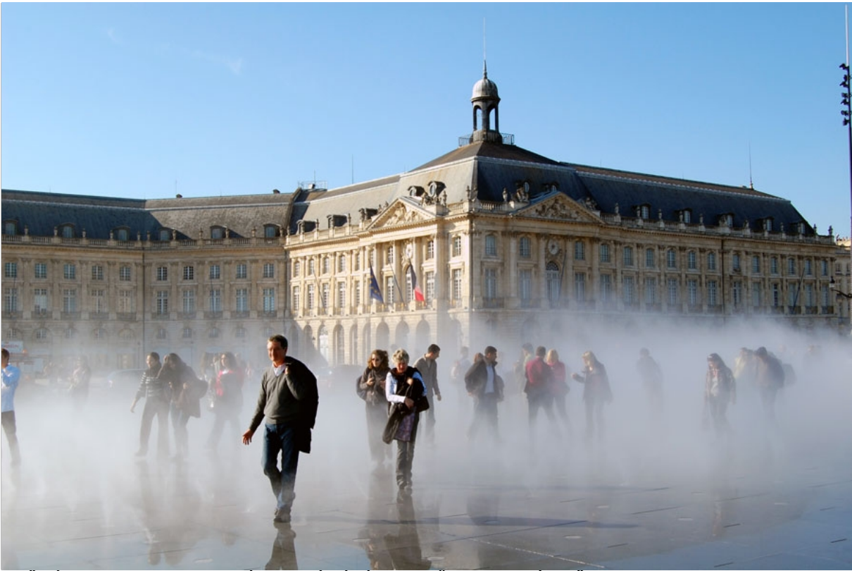
ELŐKÉP A PORLASZTOTT VÍZZEL PÁRÁSÍTOTT KÖZPONTI TÉRRŐL