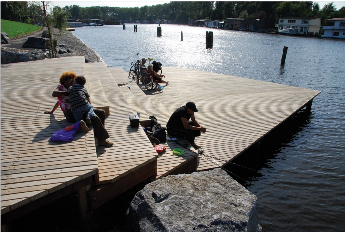
ELŐKÉP A STÉGRENDSZERRŐL