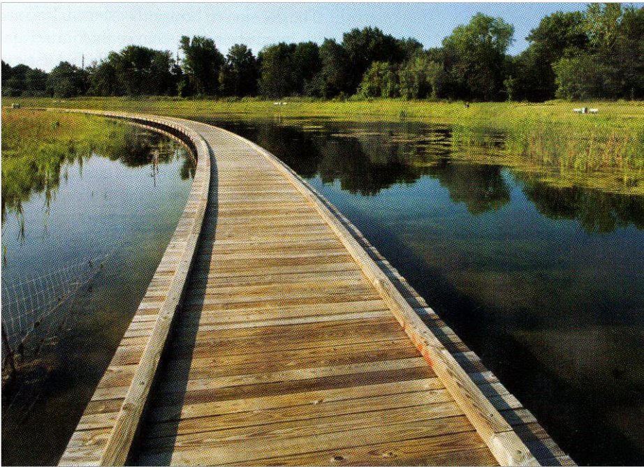
ELŐKÉP A VÍZFELÜLET FÖLÖTT ÁTIVELŐ SÉTÁNYRÓL