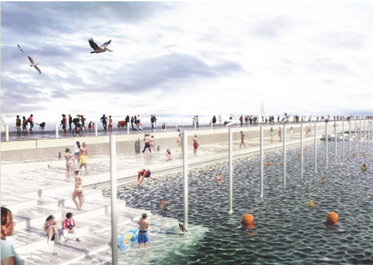
ELŐKÉP A MESTERSÉGES VÍZFELÜLETEK ÉS PARTSZAKASZUK KIALKÍTÁSÁRÓL