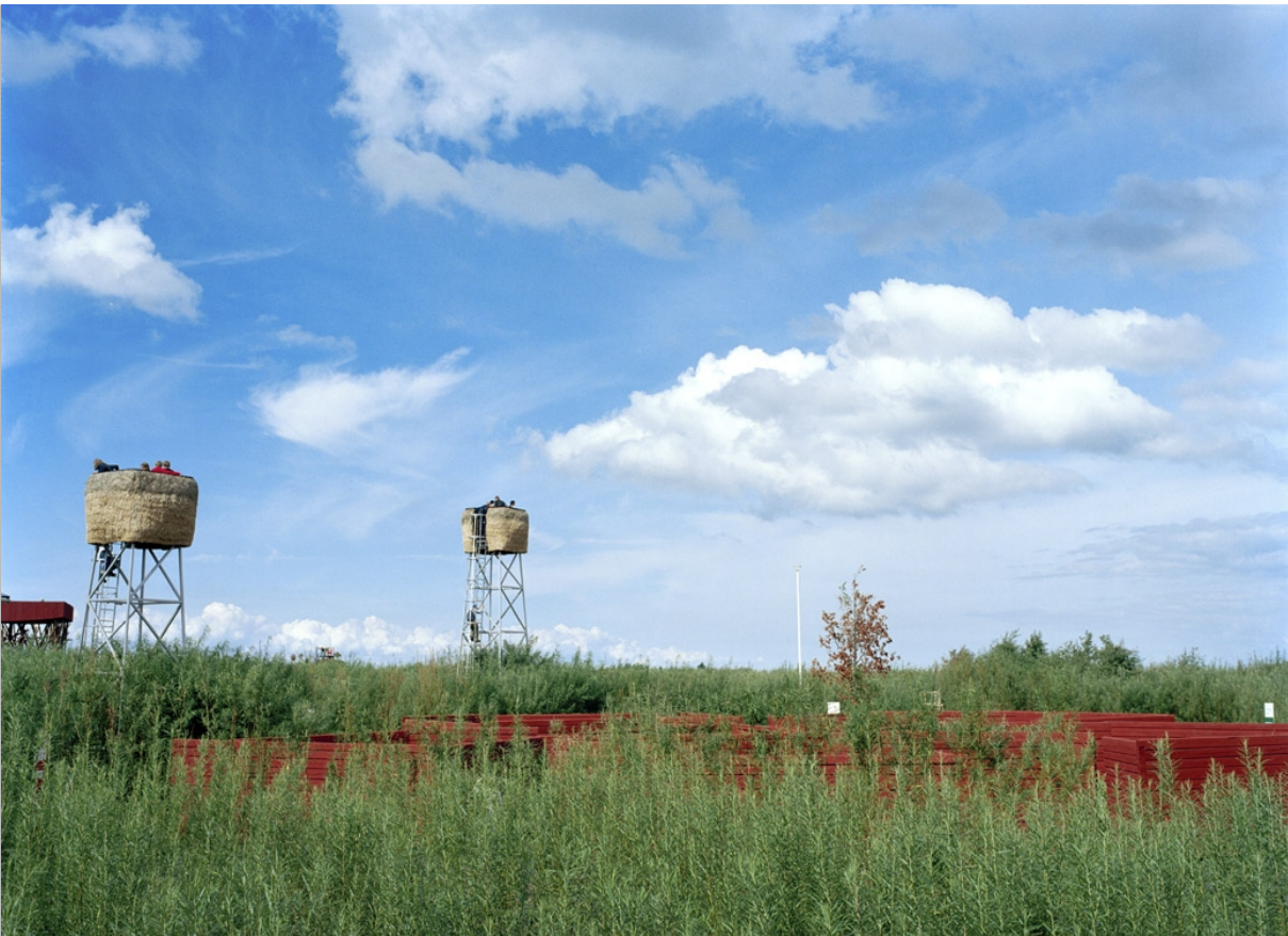
ELŐKÉP A MADÁRLESEK MEGFOGALMAZÁSÁRÓL