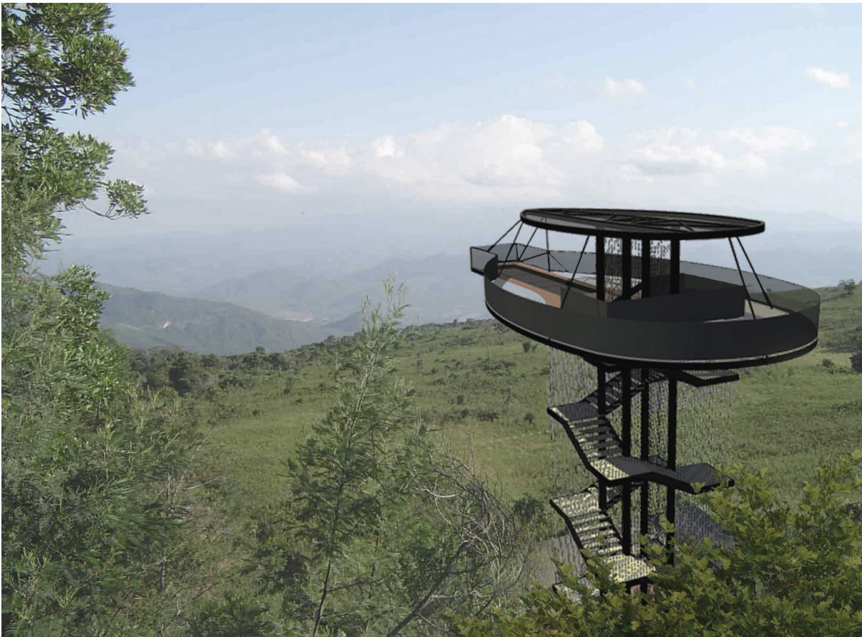
ELŐKÉP A KILÁTÓ KIALKÍTÁSÁRÓL