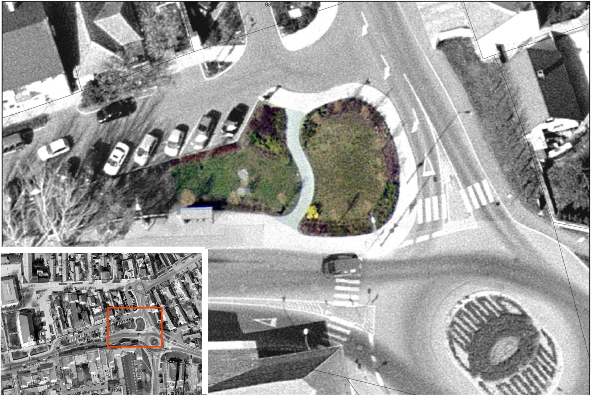
Átnézeti helyszínrajz, alaptérkép, légifoto