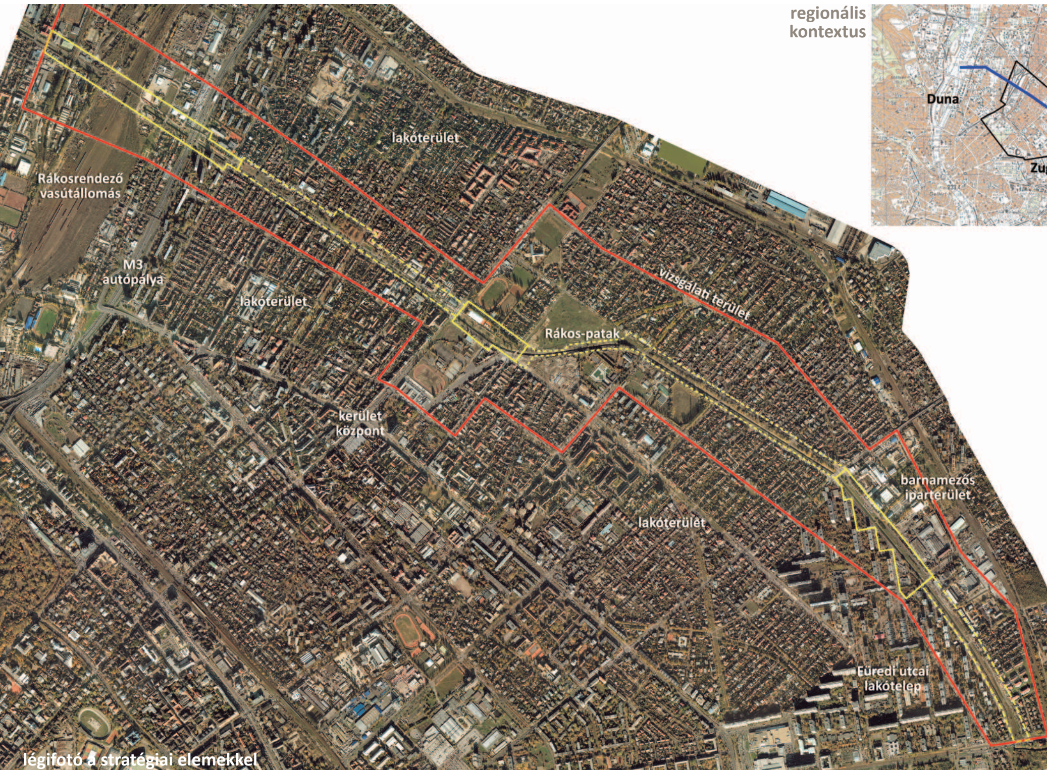
légifotó a stratégiai elemekkel