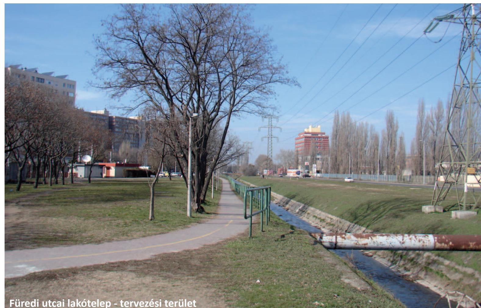
Füredi utcai lakótelep - tervezési terület