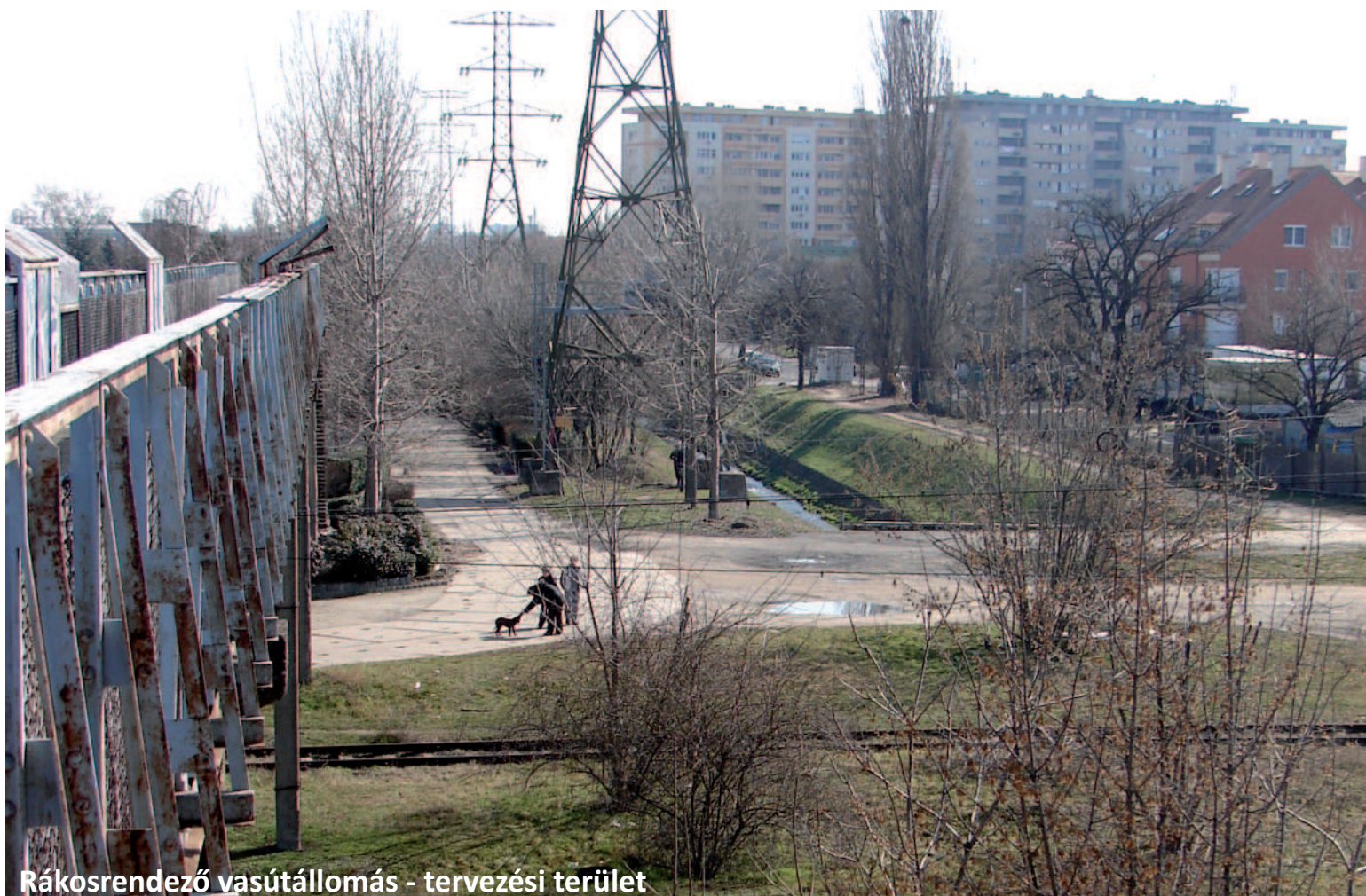
Rákosrendező vasútállomás - tervezési terület