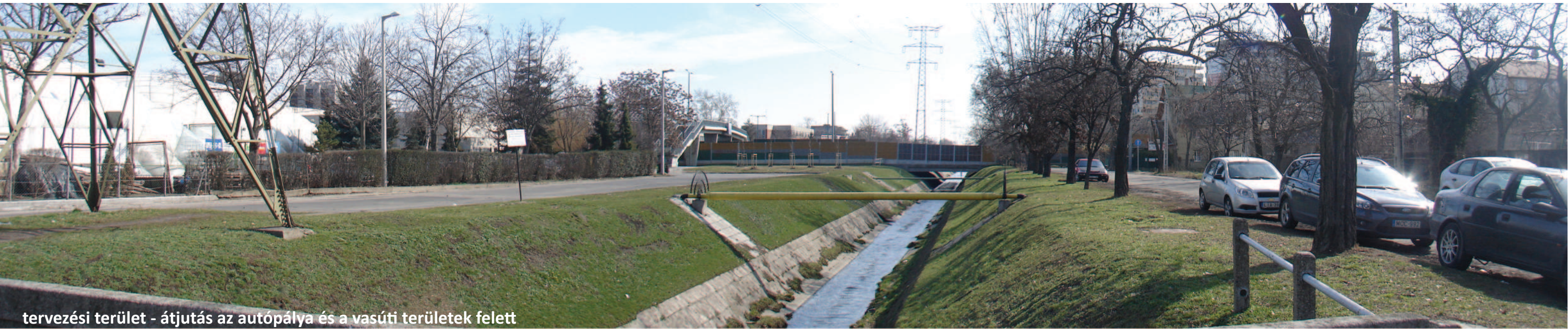
tervezési terület - átjutás az autópálya és a vasúti területek felett