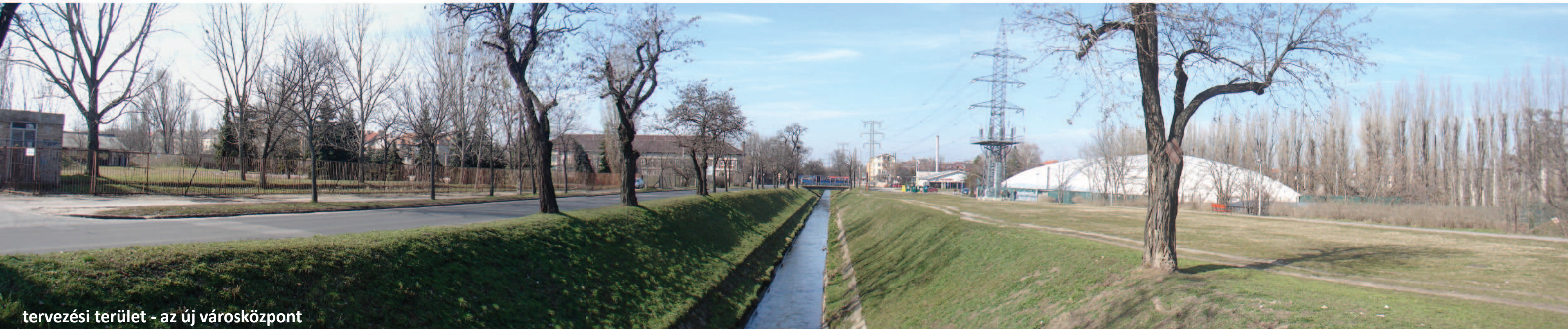
tervezési terület - az új városközpont