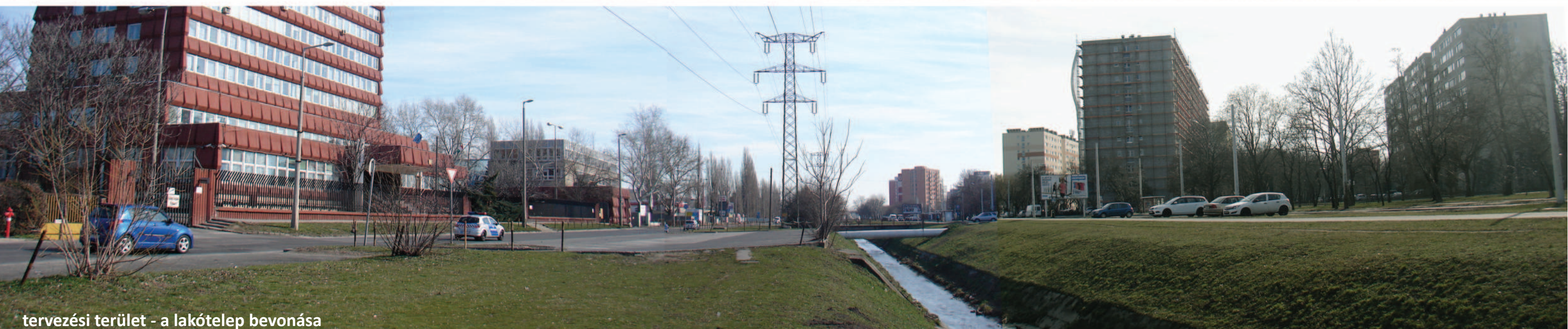
tervezési terület - a lakótelep bevonása