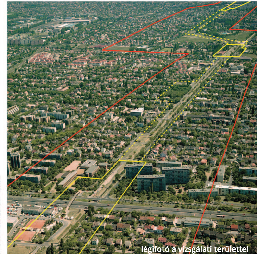
légifotó a vizsgálati területtel