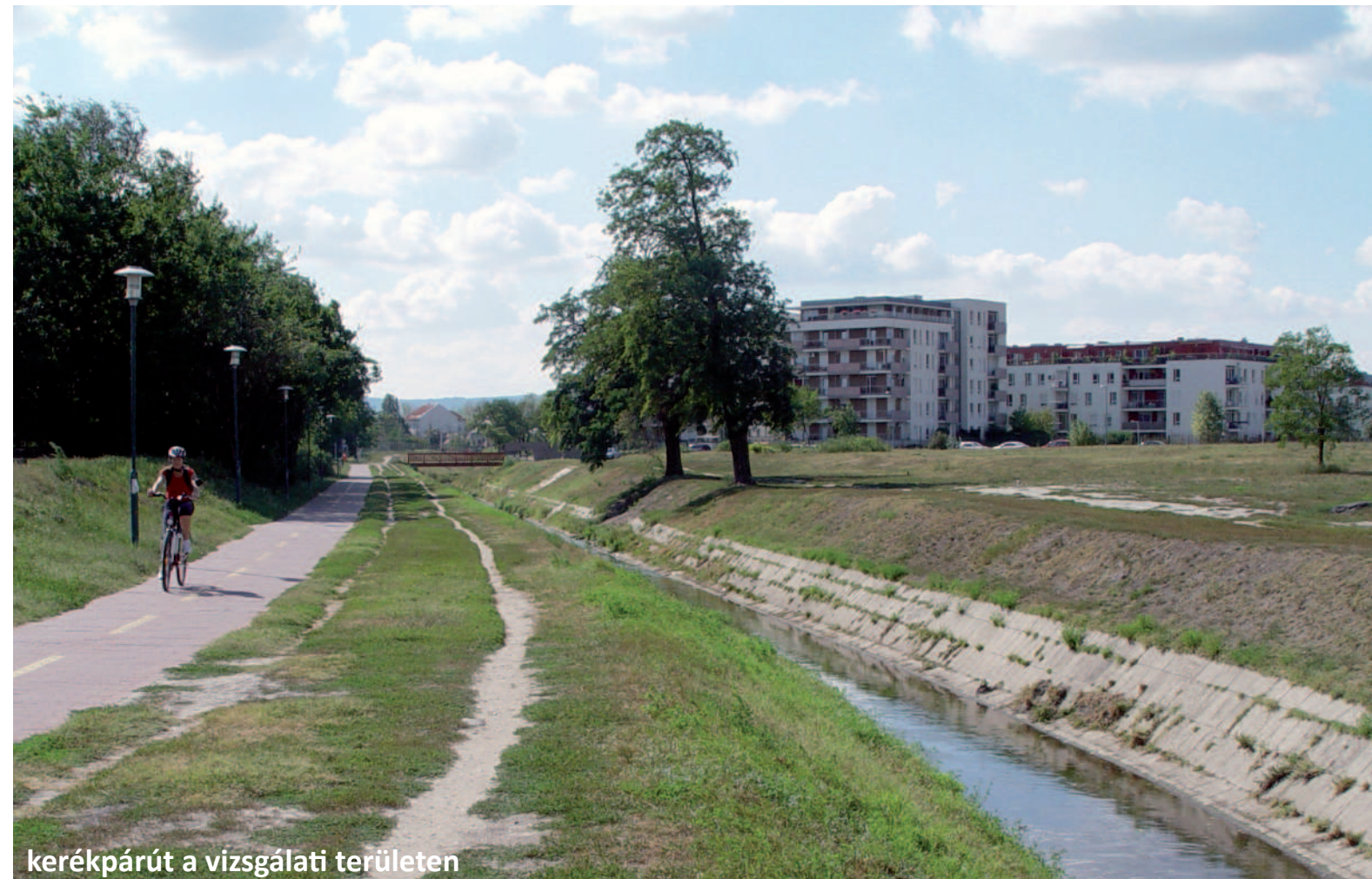
kerékpárút a vizsgálati területen