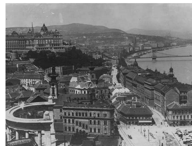
8. kép: Az Elit-Tabán, alul középen az FKT épülete (1897)