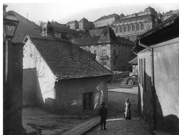
6. kép: A darabont laktanya az Ív utcából (1908 után)