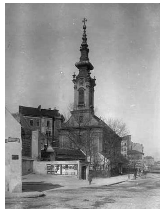
11. kép: Az ortodox templom