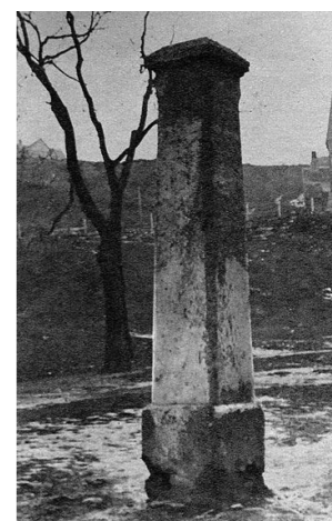
9. kép: A pellengér