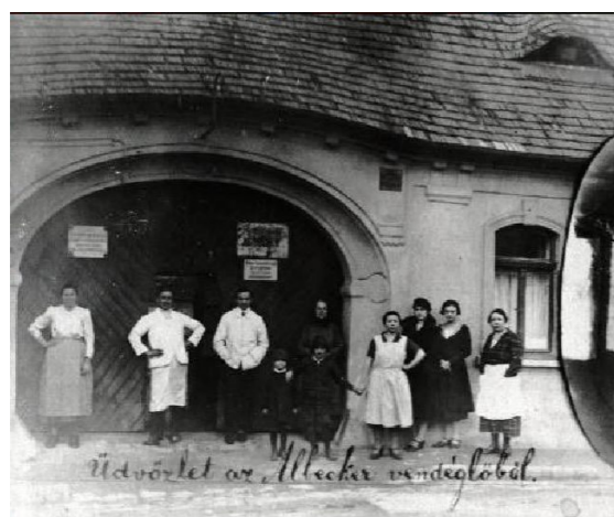
5. kép: Albecker vendéglő, Kereszt tér 4.