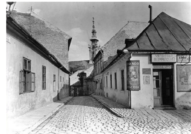
4. kép: Krausz Lipót, Poldi bácsi Mélypincéje, Görög u-Fehérsas u.