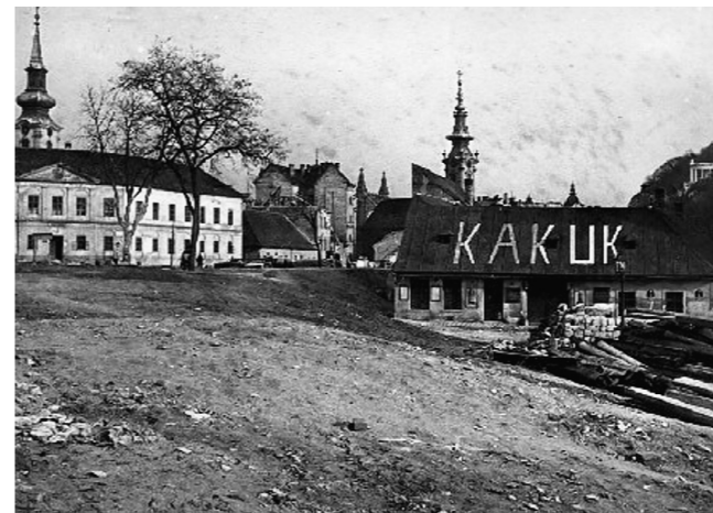
3. kép: Kakuk vendéglő, Kereszt u. 6., bontás előtt (1934)