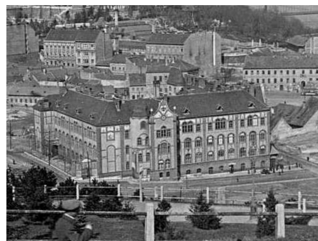
7. kép: A Polgári Iskola a Fehérsas téren (1933)