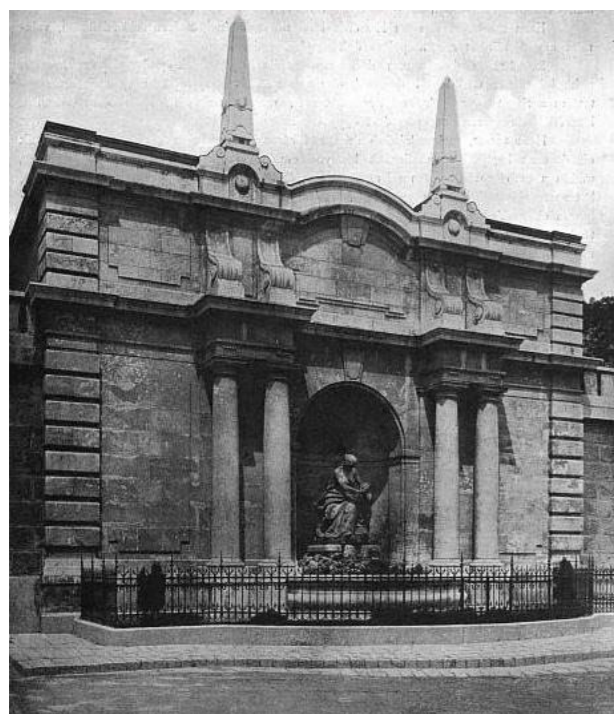
10. kép: A Hauszmann-féle Újkapu (1900)