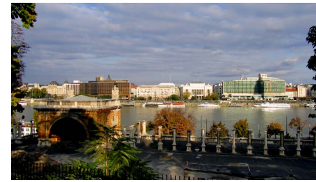
Kilátás a Várlejtőről a Várkert Bazár felett.