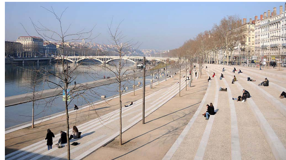
Népszerű közösségi tér a Lyonban, a Rhone folyó partján - ilyen is lehetne a Várkert rakpart.