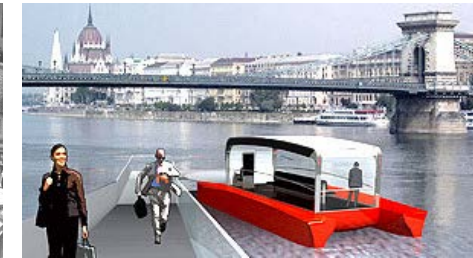
Intenzív város-Duna kapcsolat - vízitaxi.