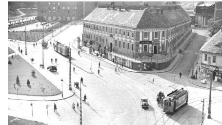
Térfalak és közterek helyreállítása - Szarvas tér.