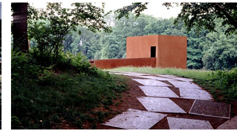
Emlékpontok a régi tabáni mulatók helyén.