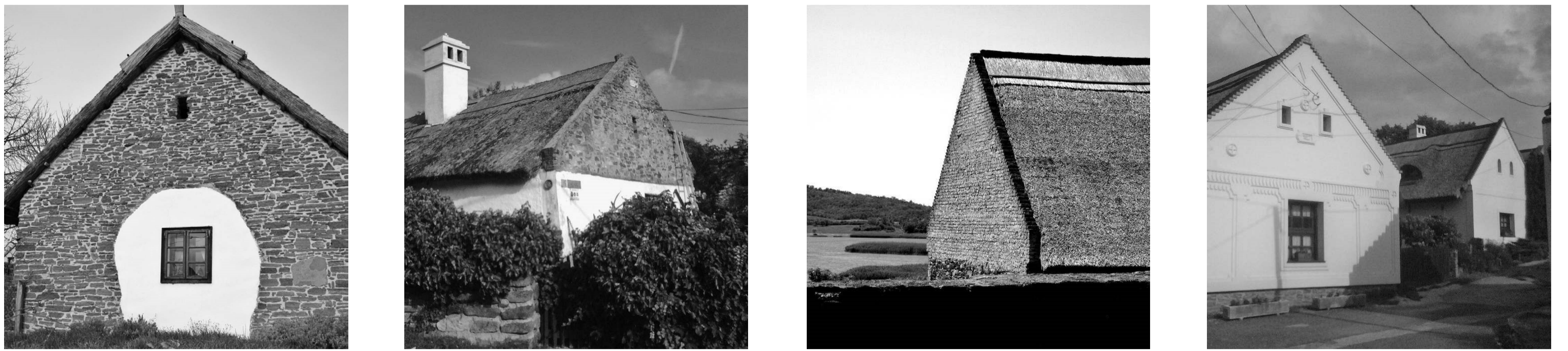
ház archetepikus utcára merőleges nádtető helyi építőanyagok, kő, nád, fa natúr, vagy fehérre festett felületek funkionalista, egyszerű alaprajzok