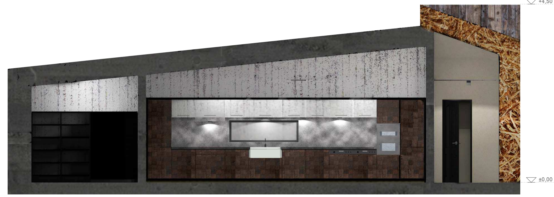
ÉTKEZŐ FALNÉZET M=1:50

Az Étkező és Teakonyha anyaghasználata részben puritán, részben korszerű, modern.