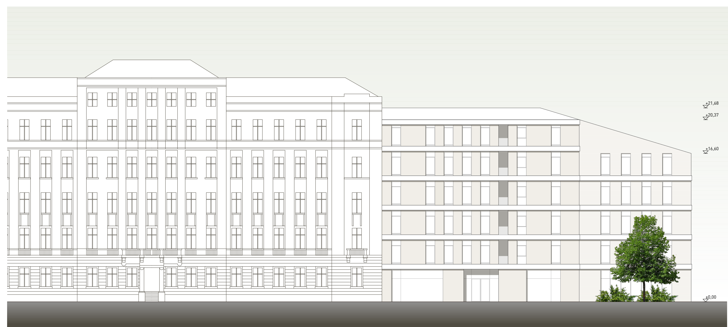
keleti homlokzat m 1:250