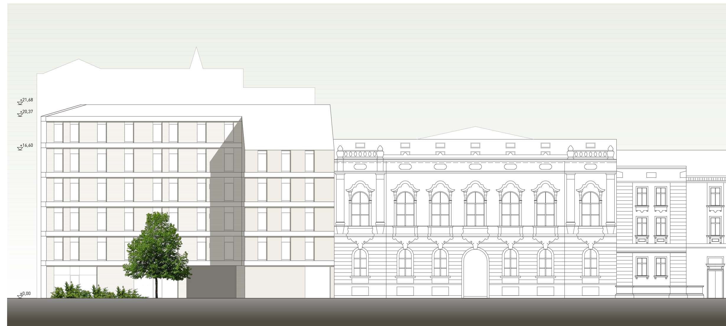
északi homlokzat m 1:250