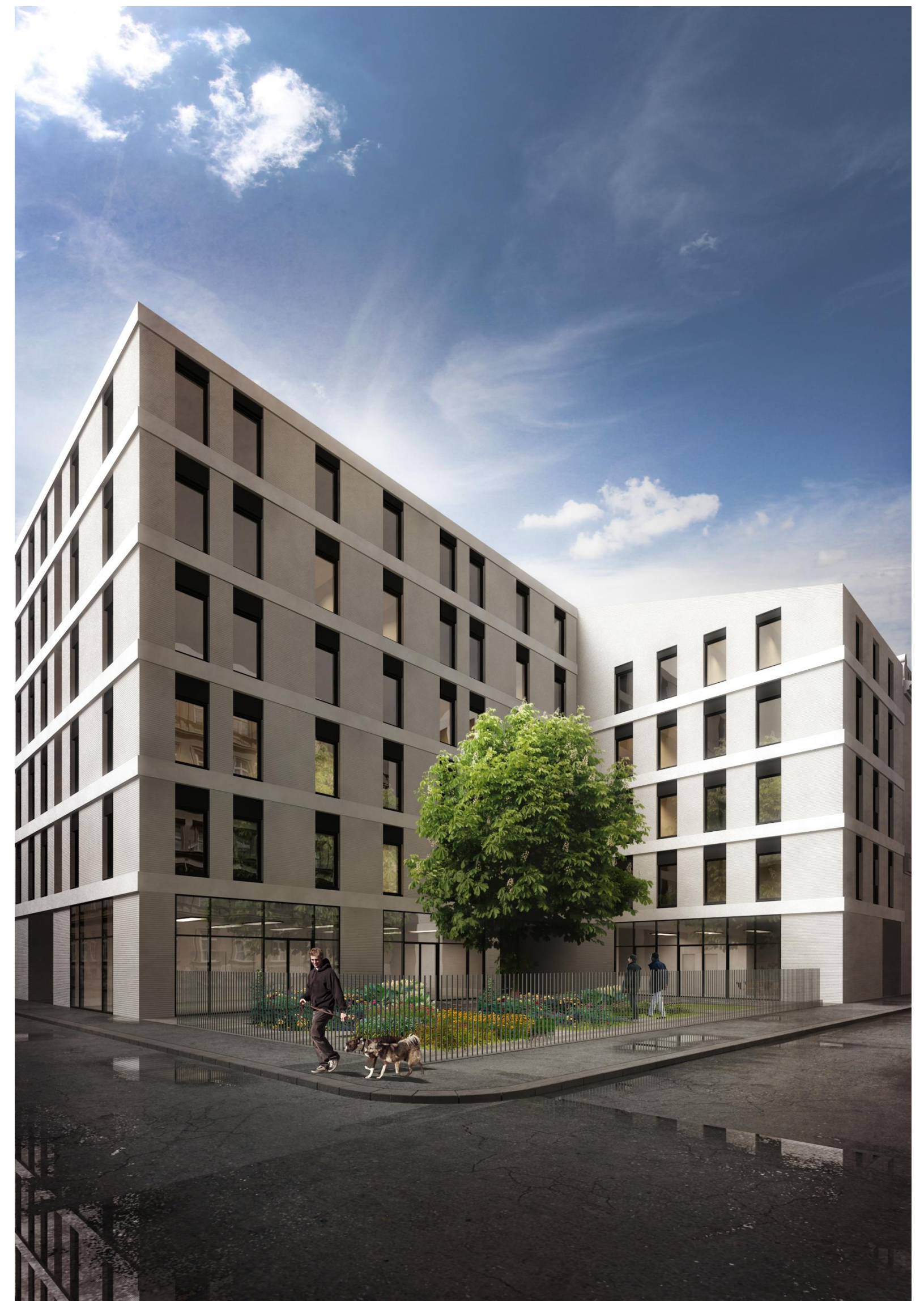
az új kert a Szentkirályi utca-Múzeum utca sarkán

tervező: 3h építésziroda 3h architecture a H-1094 Budapest, Ferenc krt. 37. t +36 1 78 777 36 e office@3h.hu