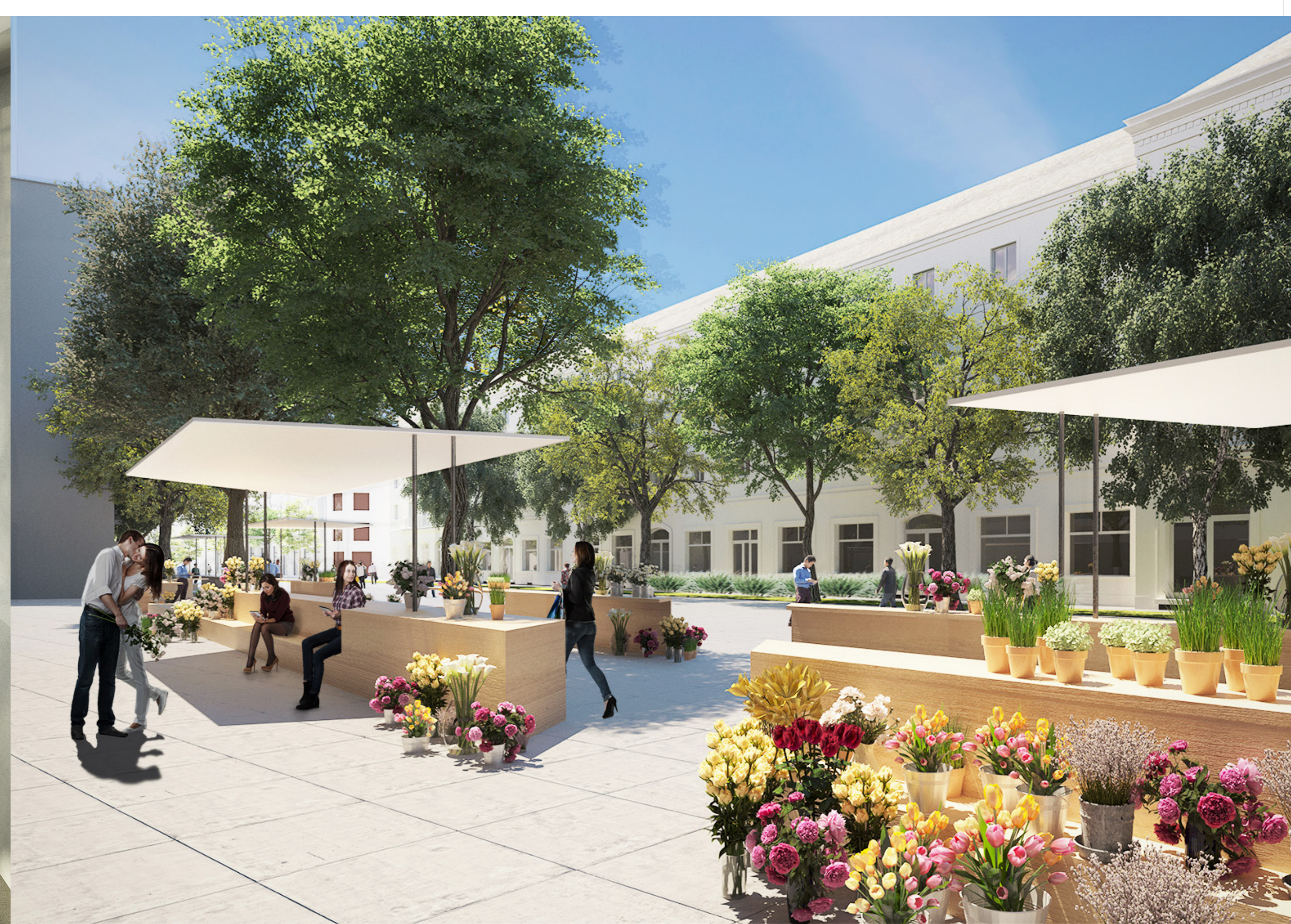
VIRÁGPIAC NAPPALI KÉPE