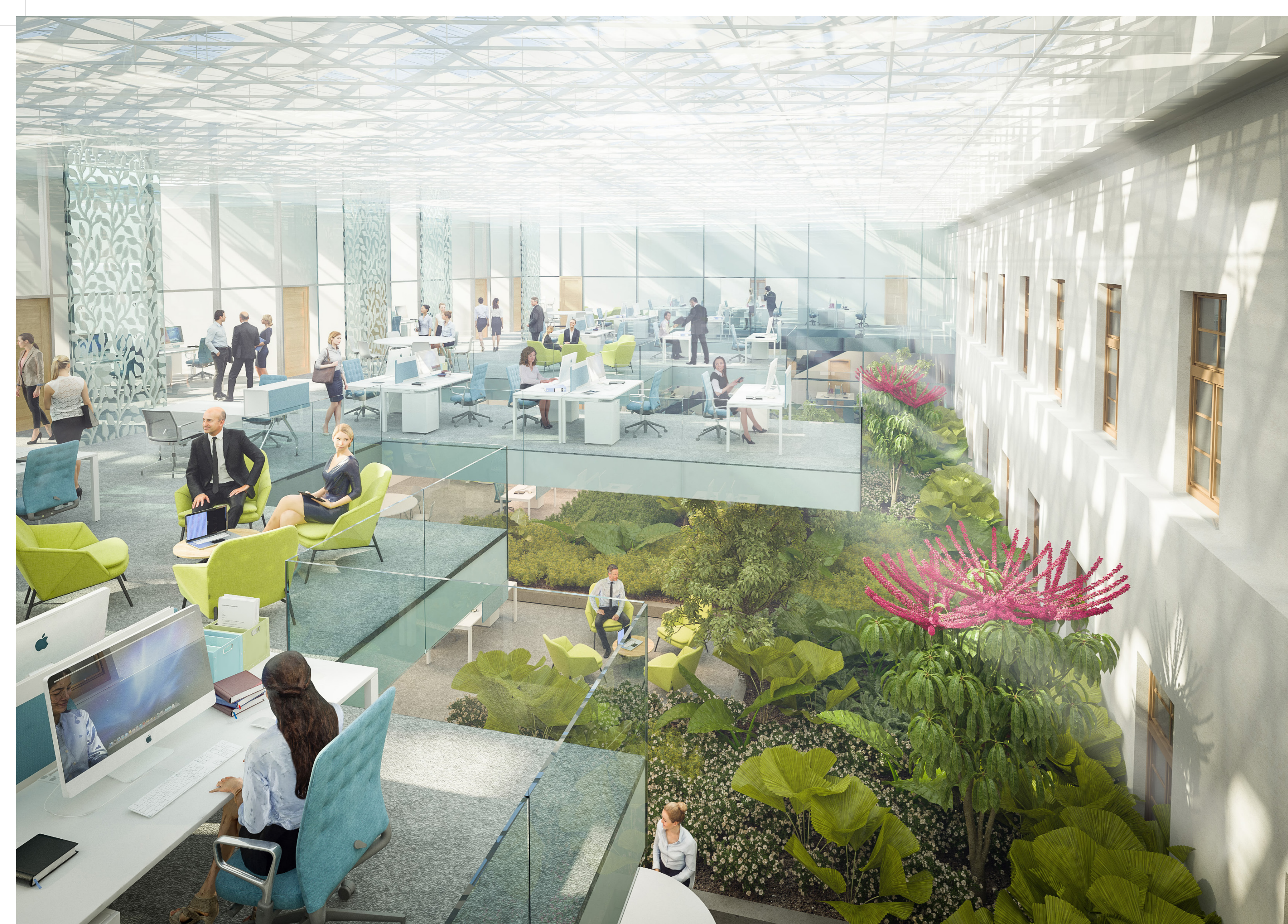
VÁROSHÁZA BŐVÍTÉS BELSŐ LÁTVÁNYTERVE