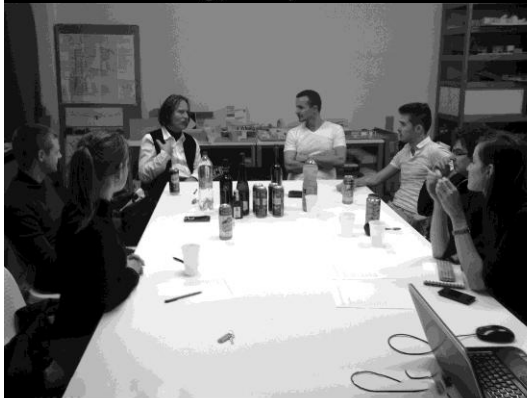
22. ábra: 2. lakógyűlés