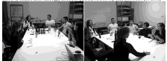
1. ábra: 2. lakógyűlés (szerző: Kiss Tamás)

A „szaktudás” bevonását és a megosztott funkciók meghatározását állapítja meg. Az előbbit jelen esetben én képviselem, utóbbin pedig a lakók fognak konszenzusra jutni. Erre a második lakógyűlésen (2015.10.14.) került sor. (1. ábra)