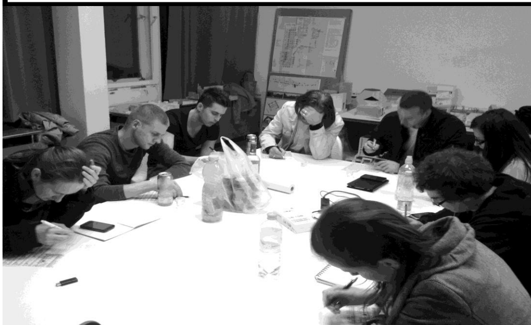
28. ábra: 3. lakógyűlés_ dotmocracy közben (szerző: Kiss Tamás)