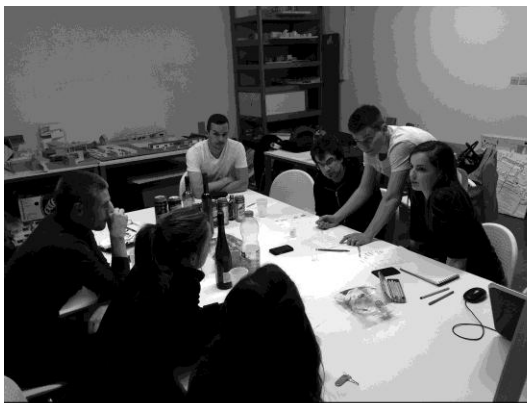
21. ábra: 2. lakógyűlés (szerző: Burzuk Dávid)