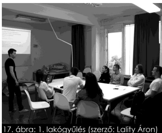
17. ábra: 1. lakógyűlés (szerző: Lality Áron)