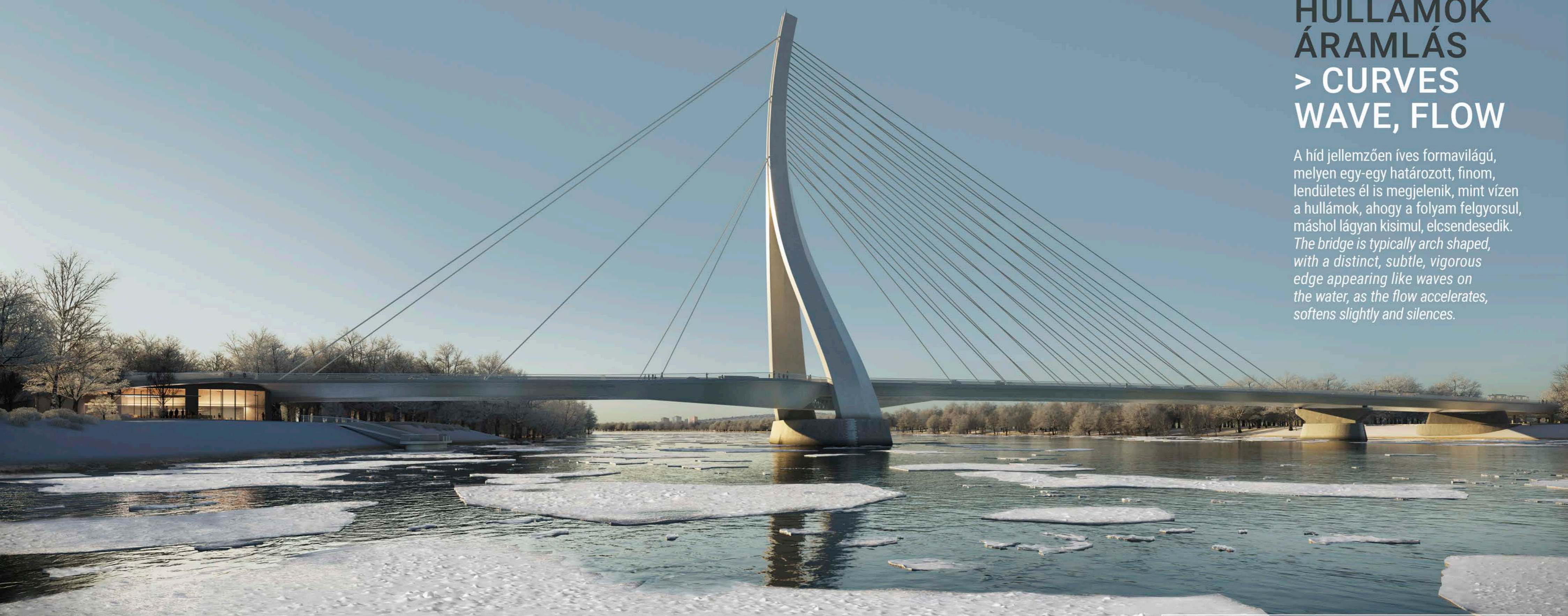
A TERVEZETT HÍD LÁTÁNYTERVE ÉSZAK FELŐL VIEW OF THE BRIDGE FROM NORTH

A híd jellemzően íves formavilágú, melyen egy-egy határozott, finom, lendületes él is megjelenik, mint vizen a hullámok, ahogy a folyam felgyorsul, máshol lágyan kisimul, elcsendesedik. The bridge is typically arch shaped, with a distinct, subtle, vigorous edge appearing like waves on the water, as the flow accelerates, softens slightly and silences.