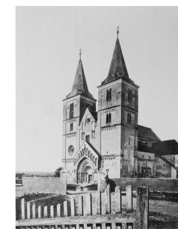
Templomkert délnyugati kerítése

A délnyugati kapu szintén mágnesszárral a belső oldalról nyitható a turisták kijáratként (automata becsukással). A gyalogos kapu mellett két oldalt egy-egy gépjármű kapu biztosítja a fenntartói megközelítését a kertnek.