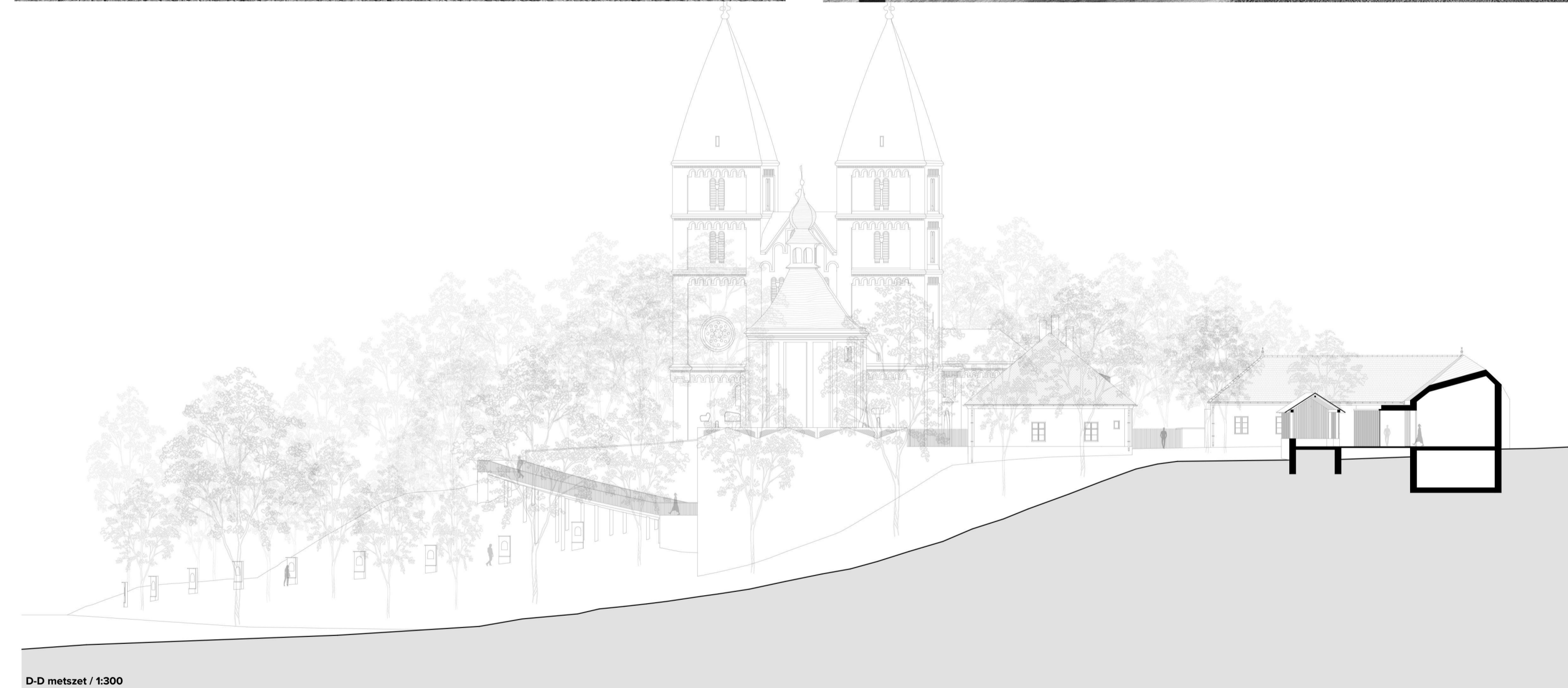
D-D metszet / 1:300