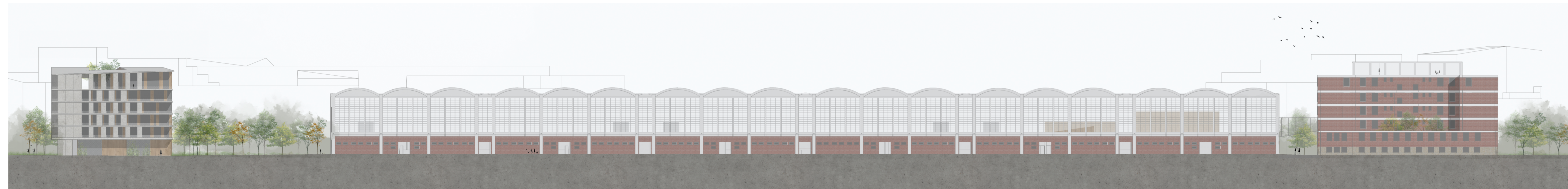
Észak-keleti homlokzat 1:500