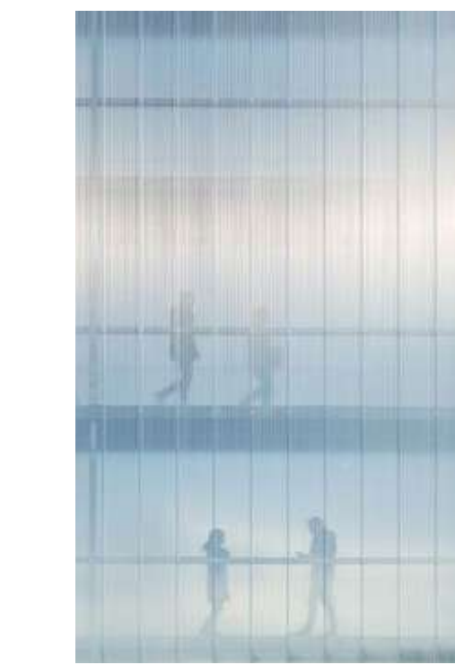
ÁTMENETEK/ KINT ÉS BENT