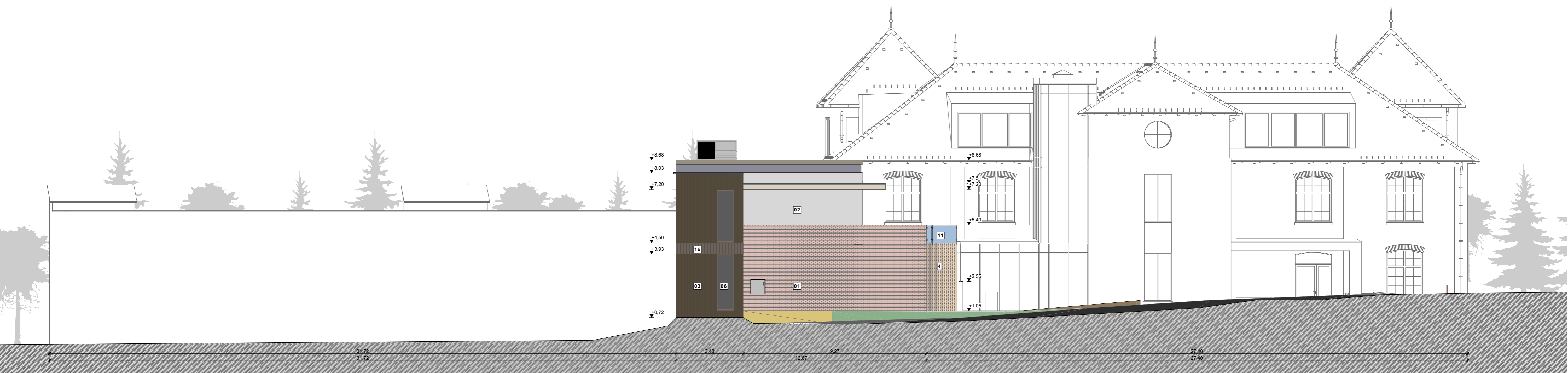
Északnyugati homlokzat (északi szárny)