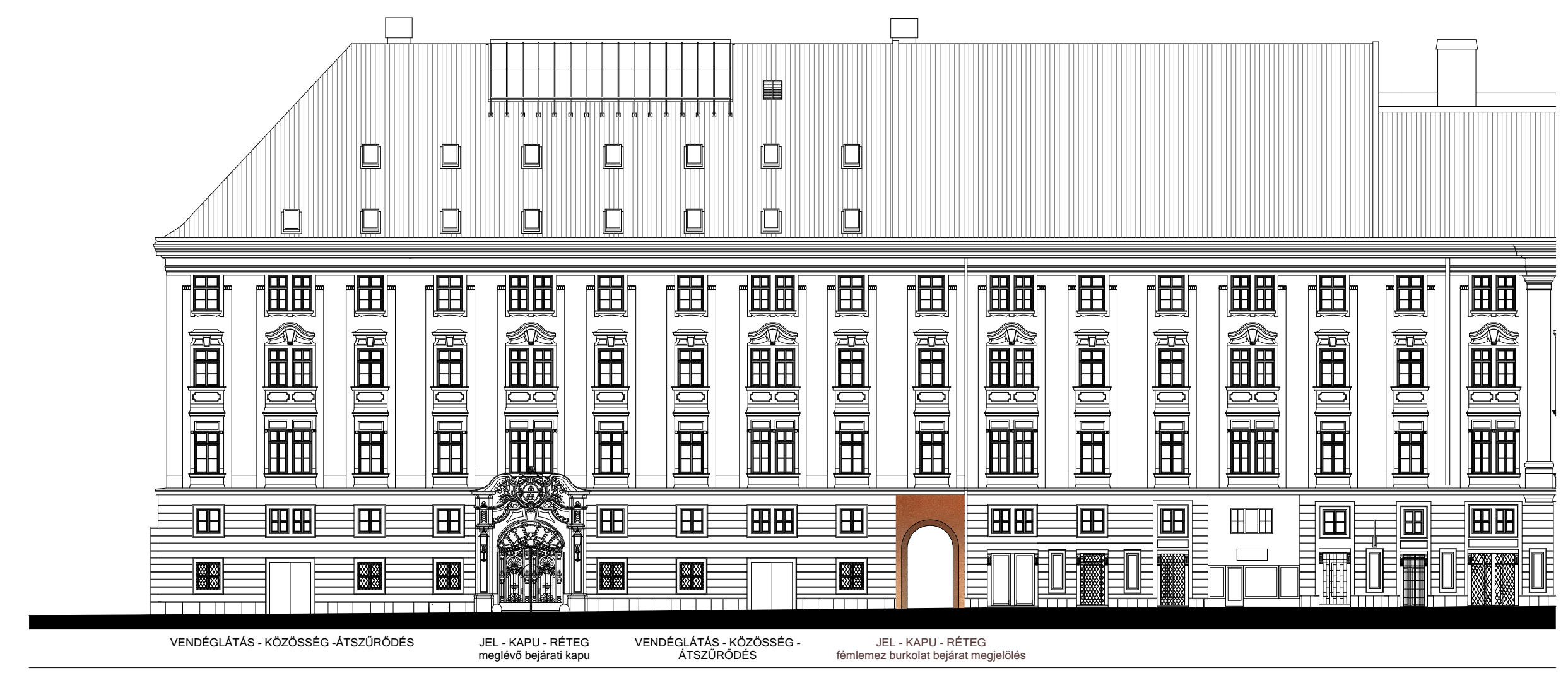
BÁRCZY ISTVÁN UTCAI HOMLOKZAT M 1:250