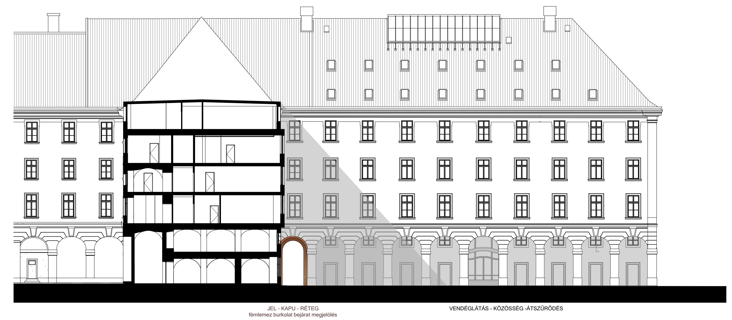
BÁRCZY ISTVÁN UTCAI SZÁRNY UDVARI HOMLOKZAT M 1:250