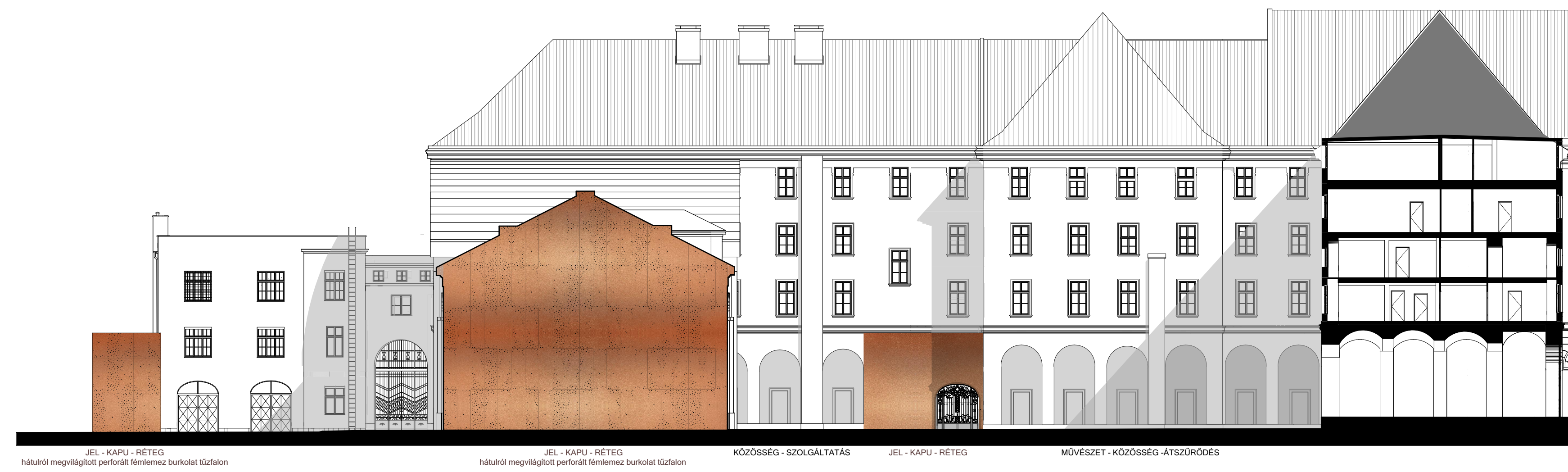
GERLÓCZY UTCAI SZÁRNY UDVARI HOMLOKZAT M 1:250