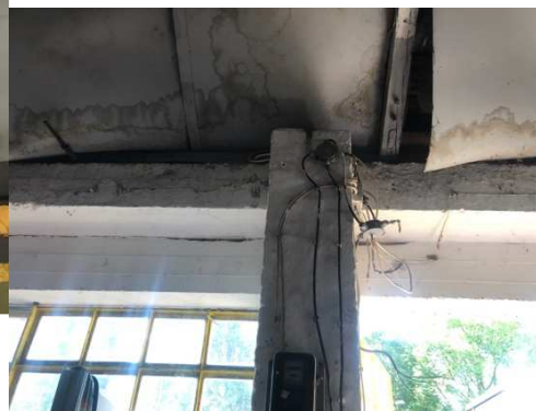
Az alacsonyabb belmagasságú raktár belső képei. Ez adományraktár még rövid ideig.